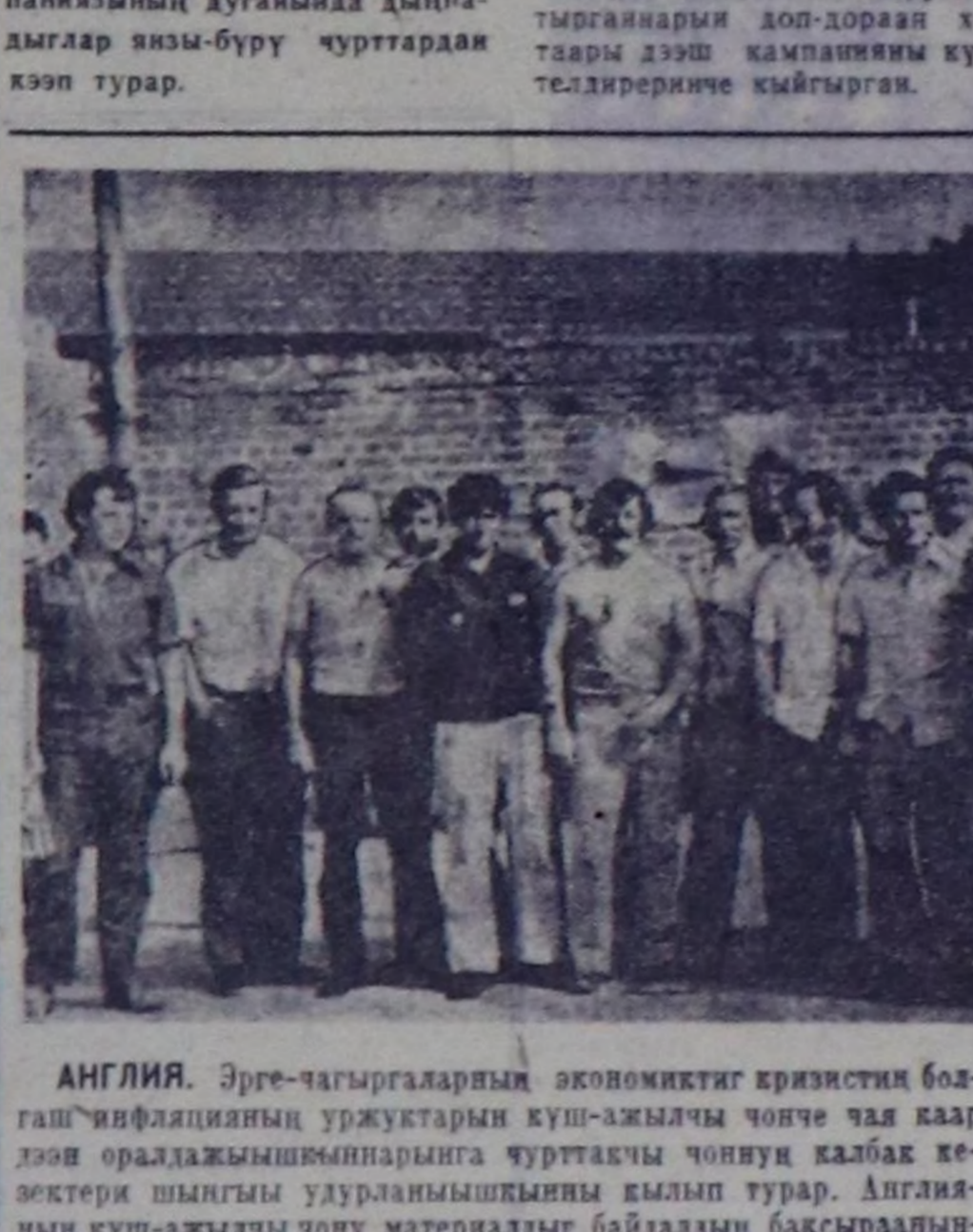
АНГЛИЯ. Эрге-чагыргаларың экономиктиг кризистиг бол-гай...