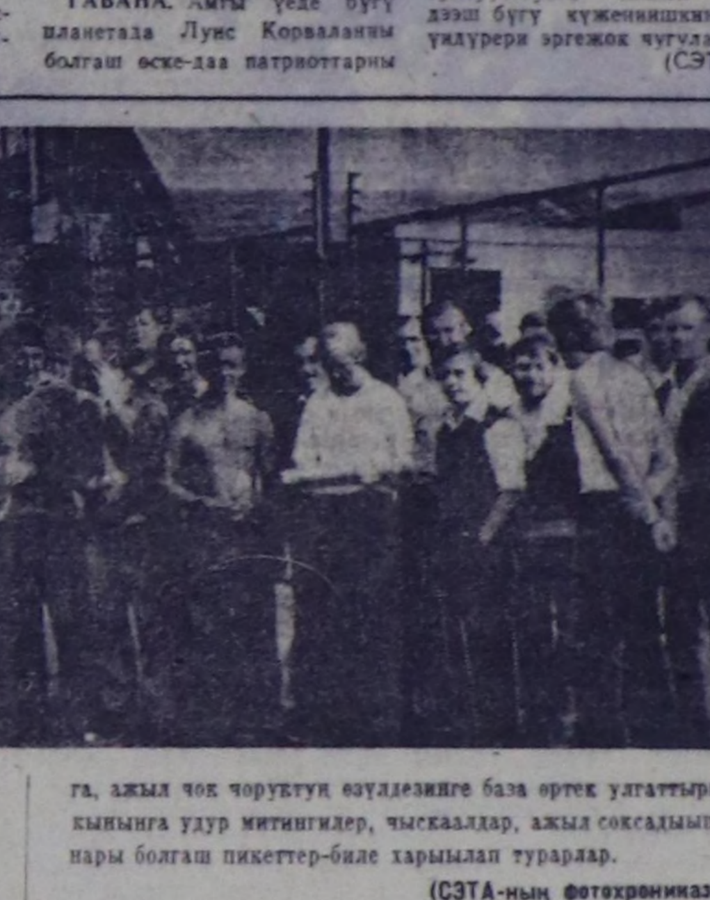
Италияның коммунисттик партияларының аныктыг шажылаарына...