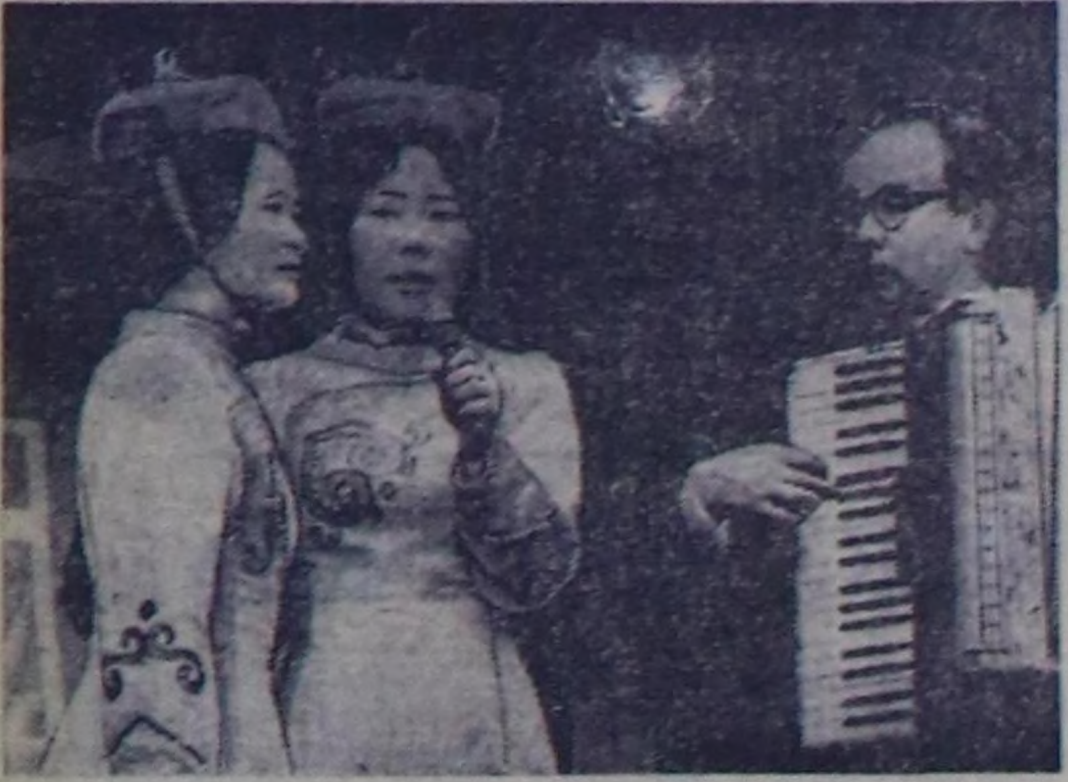
Музейге чылдым-ва чартык миллион амыг кижилер кээп, 15 муң хире экскурсиялар рө-тин тулар. Музейниң ажил-дакчылары Ленинградтың азы-бүрү ажил-агы, бүдү-рүгө чөйрөсиниң чогаалчы-мы алаа чурттал турган анык үеңизде турган хевээр тургускаа: кырым, физика-лыя, музыкалыя өрүдлери, ном-саңы, номчулга залы. Ын-да улуг зал база чараш бол-гаш оюгай көрүштүг. «Ли-ней дугайыңда састымын-кары» шүлүктүү алаа ном-чуруга, Державин магдан