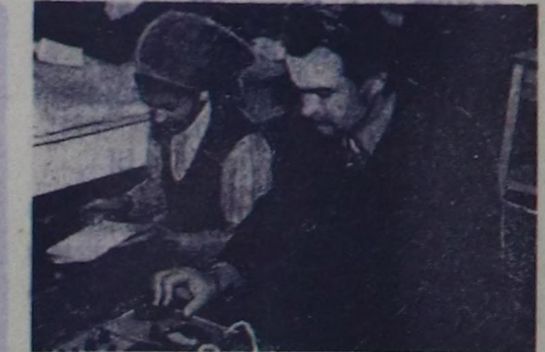
Хову-Аксыда № 18 геология партиялык геологтары