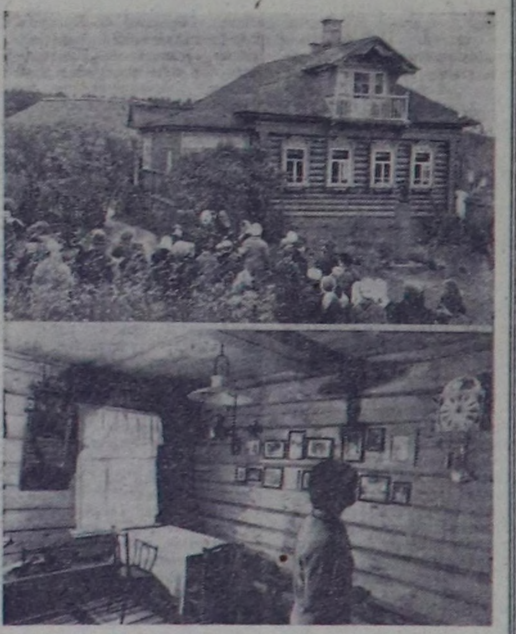
КАЛИНИН ОБЛАСТЫ. Чурунта: М. И. Калининнің башкы музейи база ол музейинң бир булуку.