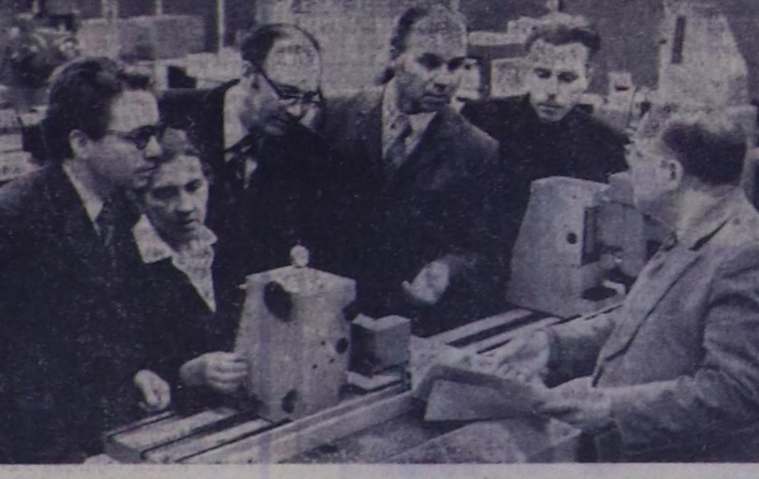
В. НОШЕВОЙ. (СЭТА-ның фотохризматы).