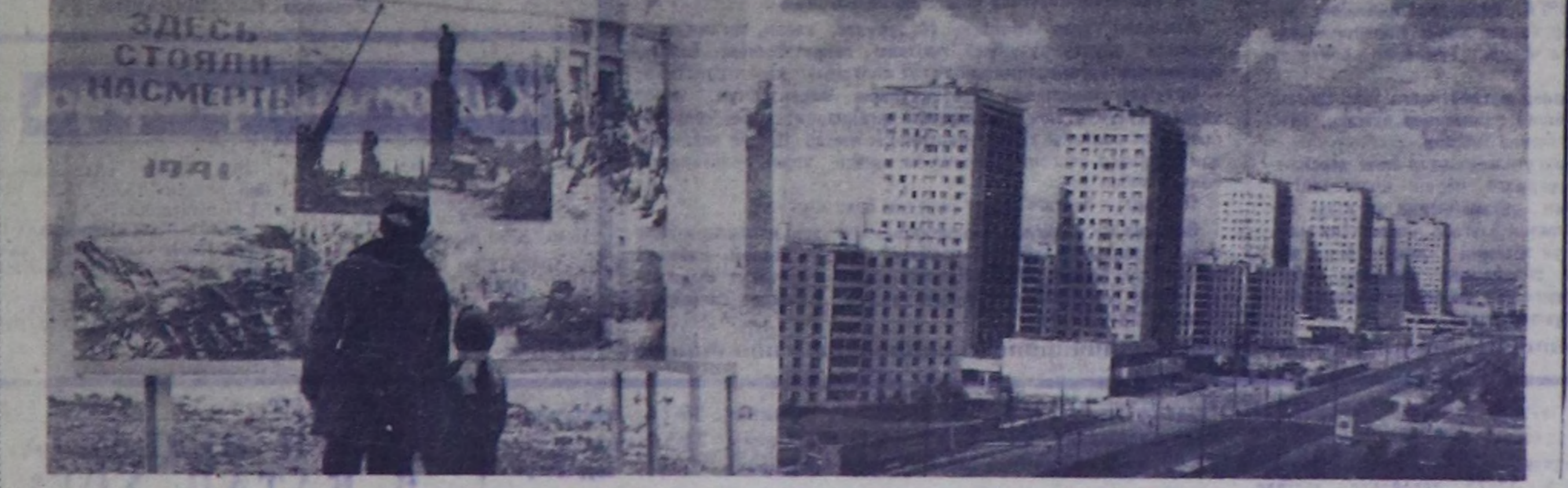
ушкү арын. ● 1975 ч. май 6

Тураскаа, сактышкымы... Бороздин шөлү. Шах бо чакы аяк күн ол бир ууудан бир ужулга чедир-ле — дөңдөр.