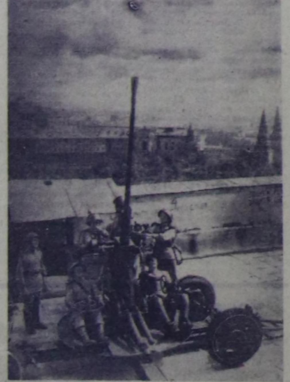
Москваның дээрин камгалаан зенитчи артиллеристер. 1941 чылдың июльдан 1942 чылдың январьга чедир хоорай чанын-га болган агаар тулушкунуңарыңа болгаш зенитчи артил-лерияның өдү-биле дайынынчын муң аягы самолеттарын чөк кылган.

1941 чылдың декабрь эрте-ниң ол шакарында бистиң тилеги-вистиң чанынчын хав-аа эгелээш үгөн. Шүүт-дээ Бердин чедир тилеги-висти километривисти бис мөгү-на Москва чанында санап эге-лээш бис. (СЭТА).