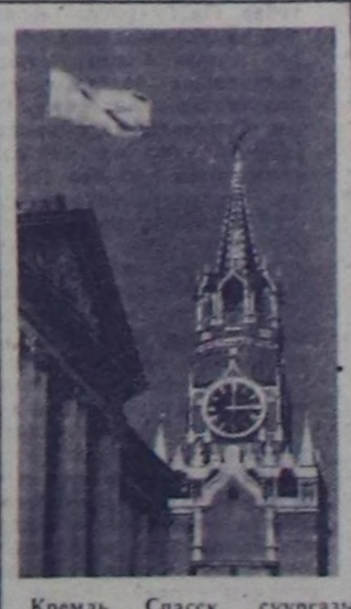
Кремль. Спасск суургазм болгаш ССРЭ-ниң Дээш Советиниң Президиумунун дамы.

Бо бөлүктөн чүлдөр маадыр-хоорай Москва дугайын, Ада-чурттуң Улуг дайынын аар-берге чылдарында найысылалды камгалап алган, оок күш-ажылчы алдарын өстүрүп көүдөдүп турар кижилер дугайын чугаалап турар.