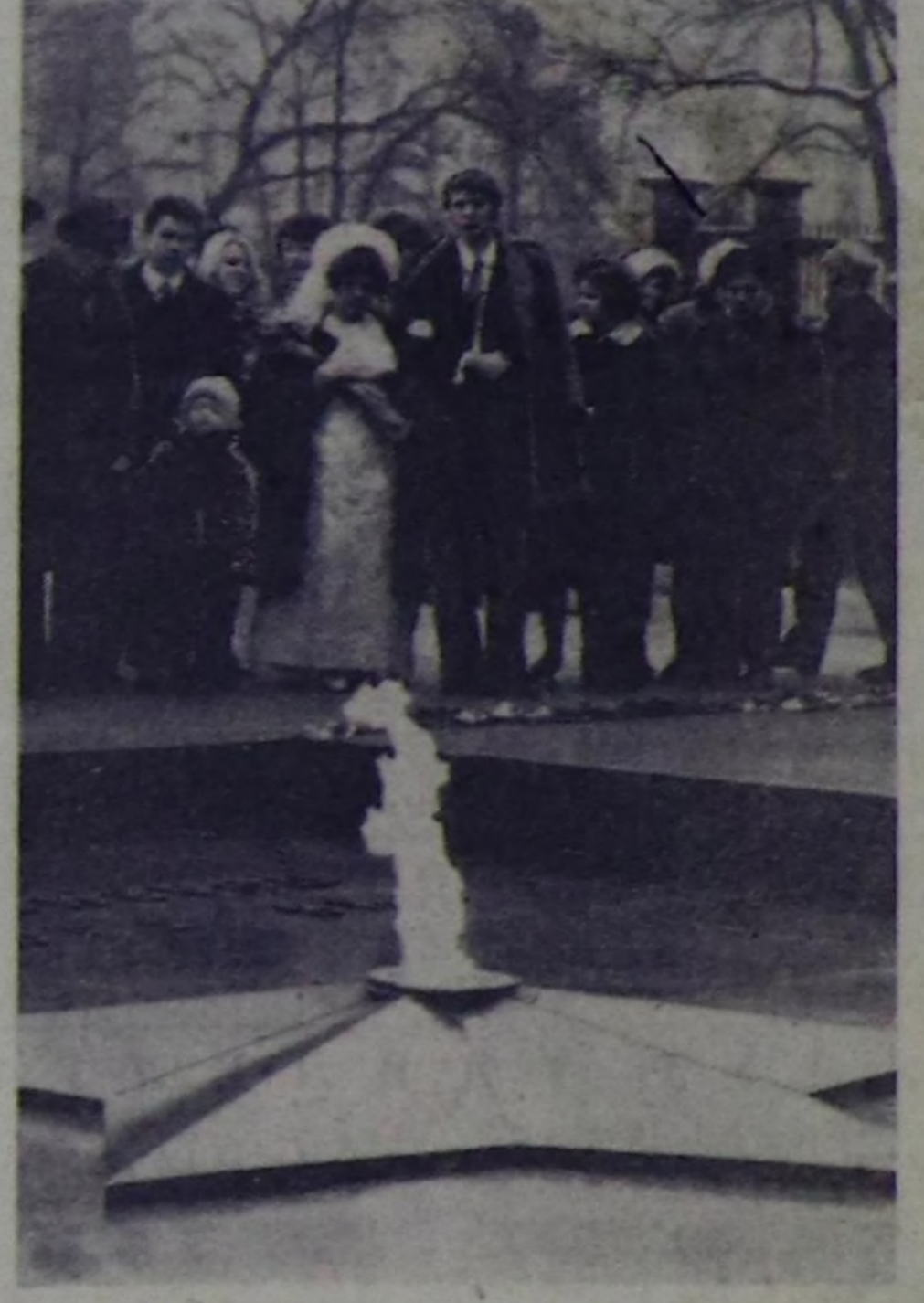
Ады билдимес солдаттын хөөрүндө.