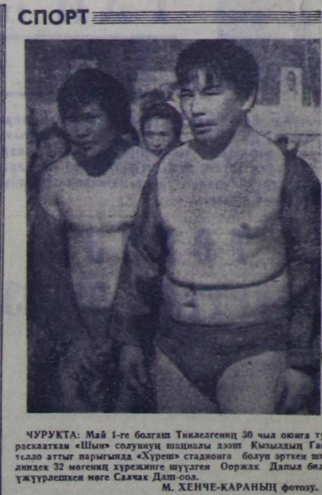
ЧУРУКТА: Май 1-ге болган Тилелгеини 30 чм оюнга тураскааткан «Шын» солуунун шиддиди дээш...