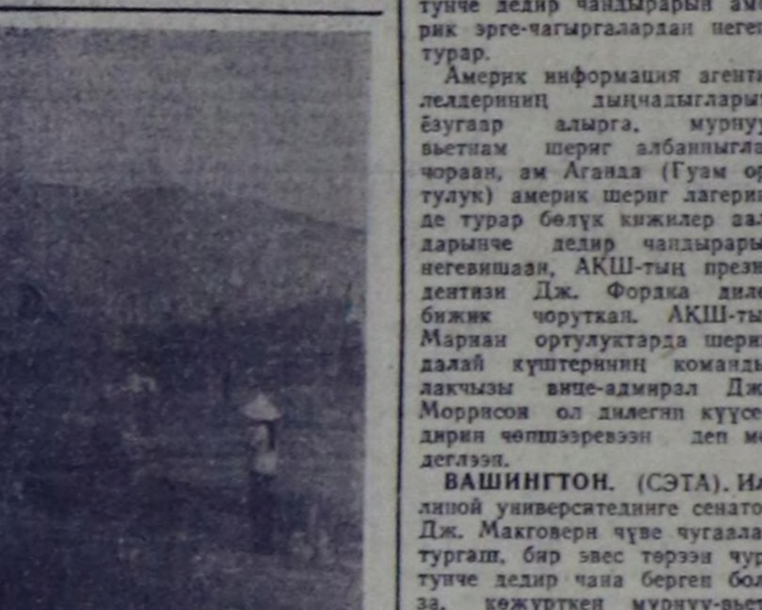
бир миллион киши аялдуу турар. Шериг административтик комитет чоңа ашы-чени тускайлап берген, кичилерге төзөш чөргөргө өзү өлүм аралы бээр төлөө-де чүс-чүс автоматшарлары, транспортун ийни-бүрү өске-лаа хемдерин кызар чүдүлөр-беле хандылар.

Иаа-Хем чөмүр-даш разрезинге хей чүм чүктээр автомобильдерге I болган II класстың чөлаачылары, газолетресварщик негеттинип турар, олар Чадаана участогунга аялдарлар.