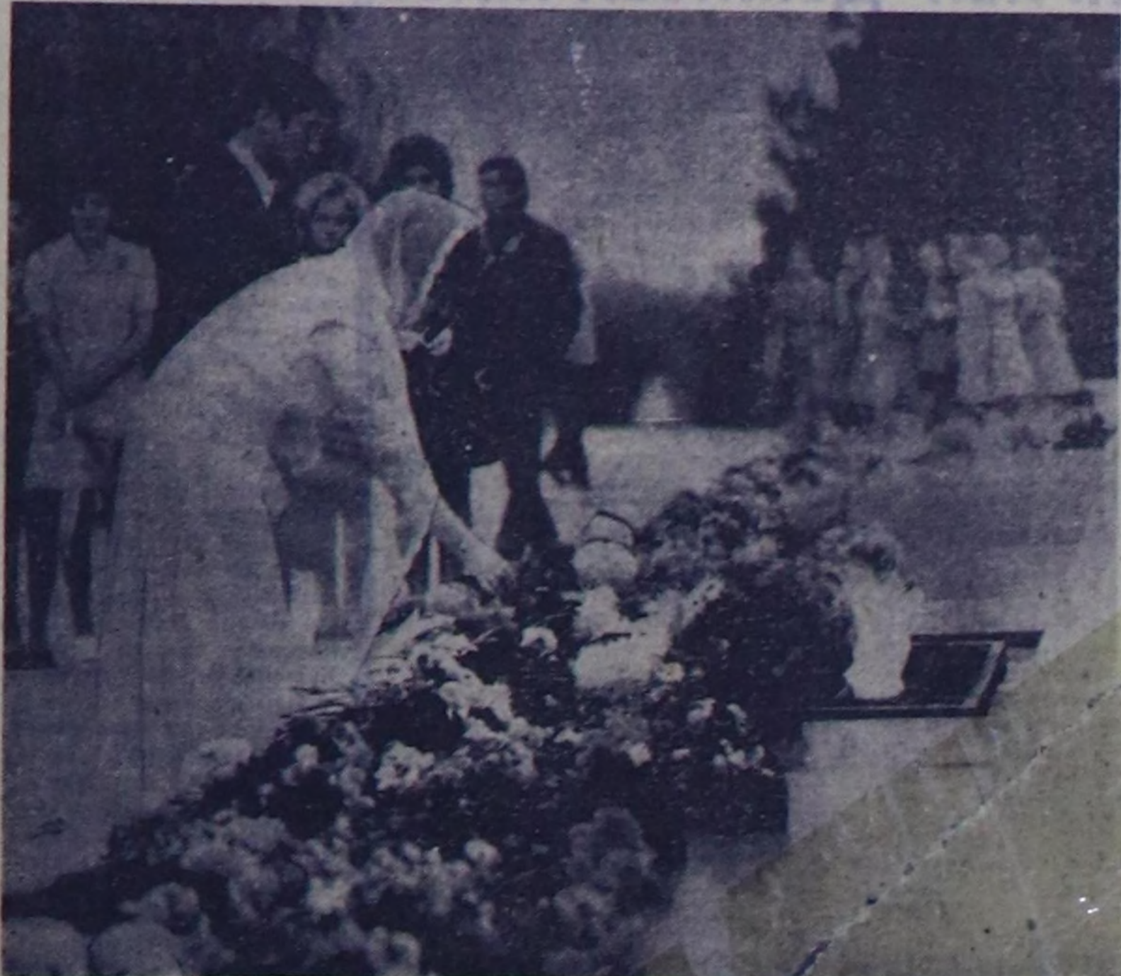
МААДЫР ХООРАЯ СЕВАСТОПОЛЬ. Чурукта: севастопольчулардың чагай чаңчылы; Салуи-Дагда Моңге от чанынга от-буае тутуу анык-апын даяг чектерин кэп салым турар.