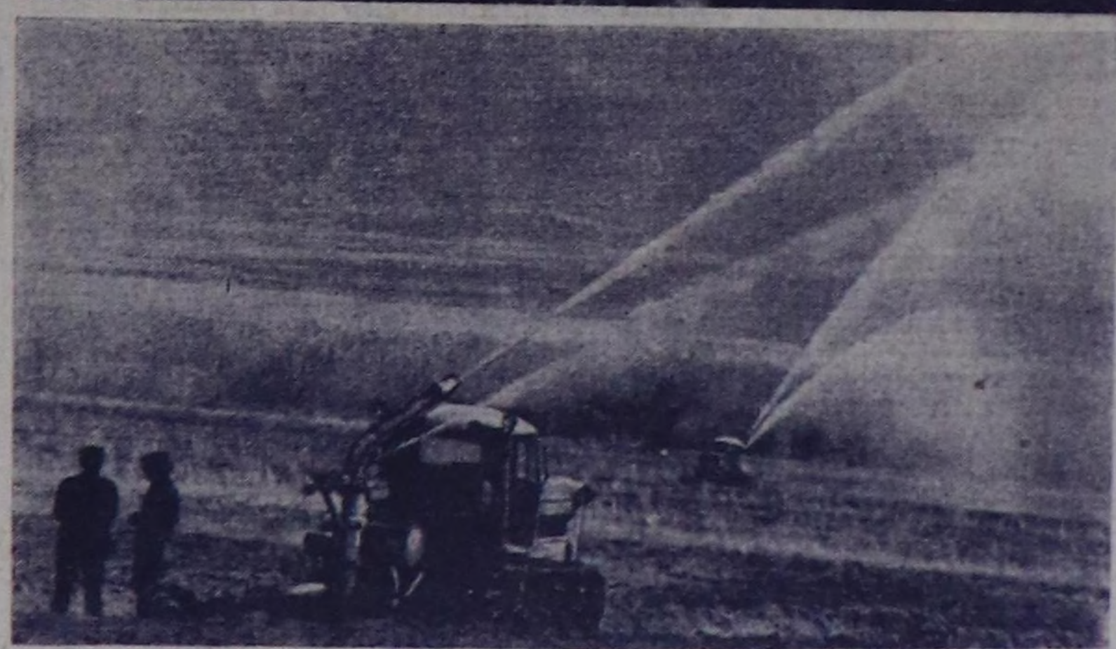
Талдамда С. Тока аттыг совхозтуң дирекциясы тараа болгаш мал чеми культураларың сугарылыгыңче улуг кичээлгеиниң саяды турар. Ажил-агыйда 900 гектар амыл чери сугарган.