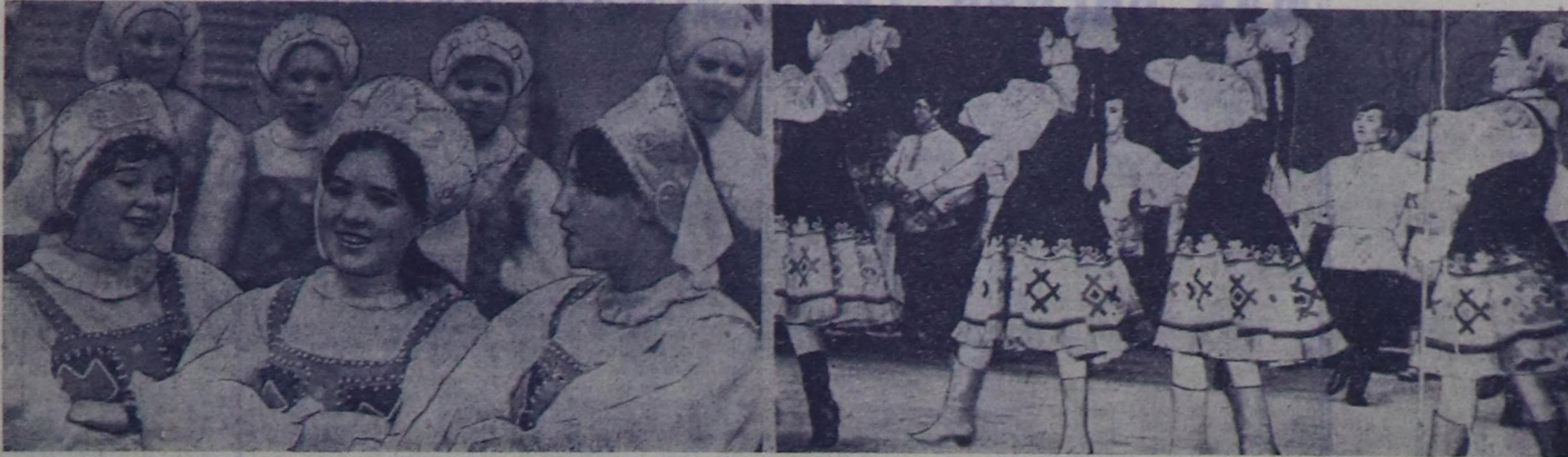
Байырлалда ыры, хөгөл баям санай чагыланыр. Баштайгы чурунта Мурманскийн С. М. Киров аттыг Культура ордуунда бот-тывынгыр артистер. Дараазын- да — «Сая» ансамблдин танцы белүү.