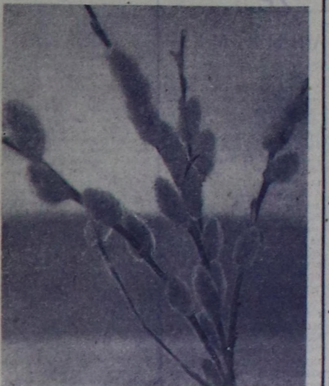
«Часны шашны белоз yshnash Частып келир анай-хаантар»