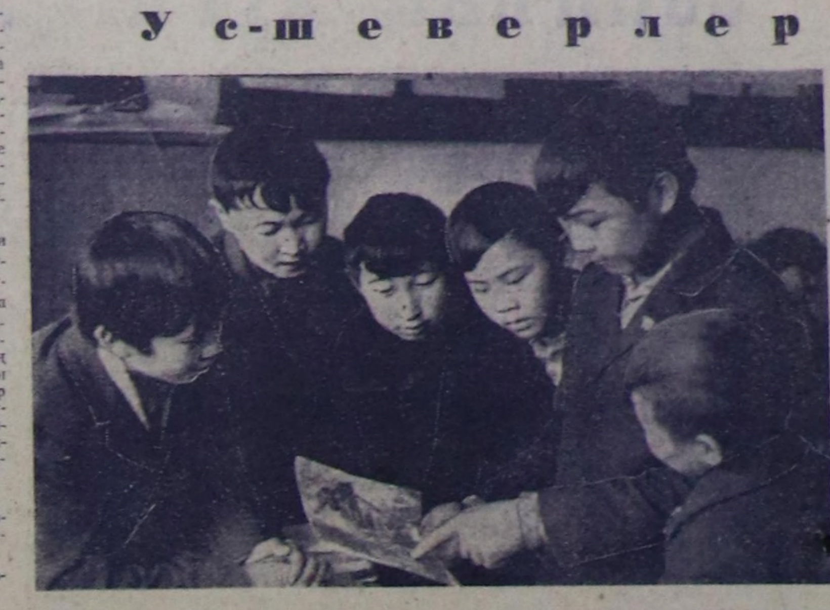
ЧУРУКТА: бөлүмүнүн киржикчилери чак эскизди сайгарып тур.

Ажык чазаныкчыларын ажыдары бидингир бооп бар чыдар. Юрий болгаш Радик Тойбухаа ашыклар Москвага эркен «Мээн Ала-чуртум» ССРЭ» деп Бүгү-эвилел сөлдүгө киржи, алаа боттарыны кылган ажыдарын баралааткан. Юрий амыга үеде Тилегиңиз 30 чылга туу-раскадып тыва эки туралыны оңу-чөкүрүн дойдан ту-дуп турар. Бөлүмүнүн киржикчилери чүгө чазанынга эвез, а чур-улуга база хандыкчылыгылар. Тилегиңиз байралагына тураскааткан чуруга делегелерин школяның пионер өрөндөгү ажиткан. Бөлүмгө оң ирунда чылдарда чазан болгаш мурдан эки чүдүлөр школа музейинде тускы боду-дуду эвез. Олар ам районуну школяларынин техникте чогадылганын делегелерине киржир. В. САЛЧАК.