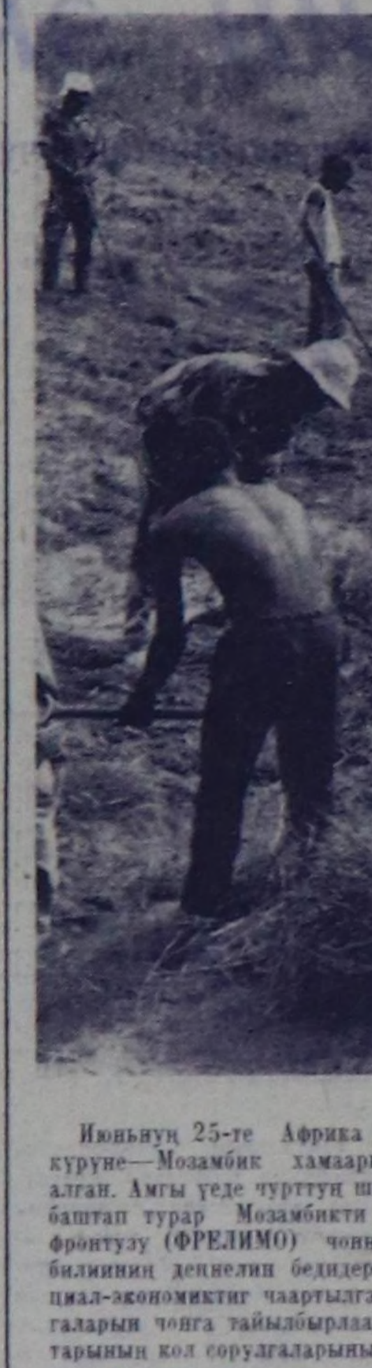
Июньнун 25-те Африка дийте база бир кургане—Мозамбик хамаарышпас өргөнү алган.