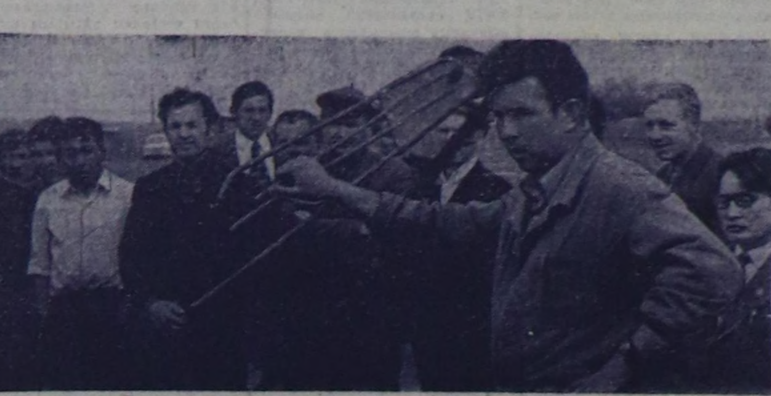
Мал чөмч белеткээринде болгаш дүжүт ажаап алымшыкканың талазы-биле республика семинары болган.

1975 чылда мал чөмч белеткээрине болгаш дүжүт ажаап алымшыкканың техникасы бедик бүдүрүкчүлүг ажилчары талазы-биле көдө ажил-агый-да инженер болгаш агрономия албанының согулааларына тураскалган Тыванык көдө ажил-агыйың дуржулга станциязыңа июнь 20-де болган республика семинарыңа келер кышка мал чөмч белеткээр баазаның тургузууңагы айтырылгарың бүгү талагы чугаалажып көргөн. Республика семинарыңа көдө ажил-агый министриниң механизация талазы-биле орданың В. П. Брокхерт илеткен эмгекти, шилчирип мөчүн чөмч-биле хандырагың болгаш мал кышга-агыйыңың чедириңиң эрттирениң талазы-биле хемчеглер дугайында СЭКП обкомунун бөрөзүңү болгаш Тыва АССР-ниң Министрлер Чөвүлелиниң доктаалы күүүселин херекте амгы байдалың дугайың, а ол мынкан 1975 чылда республиканың колхозтарыңа болгаш совхозтарыңа мал фермаларын механизастаарыңа, чөмч белеткээр хектерин, тараа кургалар, арыллар пунктунуңуң база өске-даа объектилерин тударып. Техниканы камың азылдеп, белдык башкарар. Оң машина-ах 100 муң километрин кандамың дүжүт ажаап алымшыкканың талазы-биле көдө ажил-агыйың дуржулга станциязыңа болгаш республика семинарының киржикчирин районнарыңа көдө ажил-агый бүдүрүлгө эргелдериңиң на-чалыктыңа, колхозтарыңа, совхозтарыңа удуртуулгарыңа, агрономнар, инженер-техниктер ажилдакчылар удуу-биле