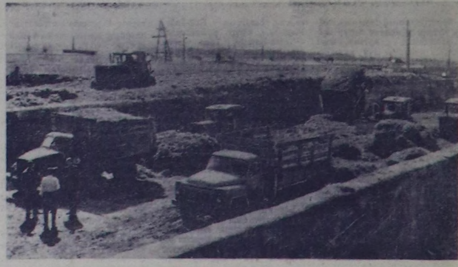
Молдавияда малга чөм белестээр ажал калбарган. Колхозтарын Каменка район чөвүлениң мал чөдирин белестеп, бүдүр каттыктыкын бө чөдир оң ажал муң тонна ажал ийи-бүрү эки хоолауду мал чөдирин белестээр деп шиттирээни. Амгы үдө тускай тургускай бригадалар хууну-не 400 тонна чөдир ногаан массамы белестеп турар. Ол бүгүн дөдөдүн санаж

кылар оңгарларга чөдирген, оң ситен адал