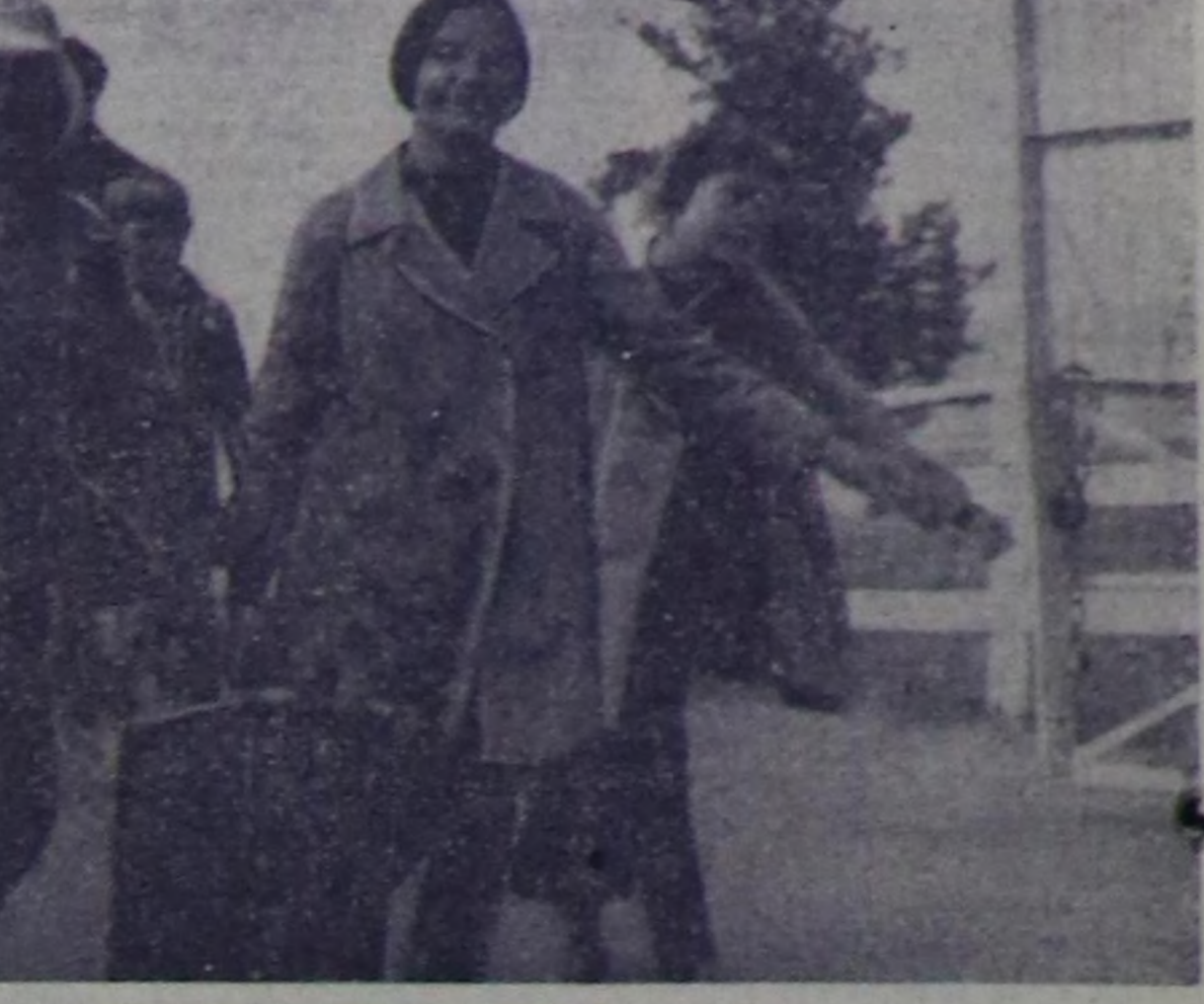
Бистид республиканын школаларынч кайгы дыштанылганын айткыч уулулар болган Гагарин атыг пионер лагерини дүүн байырамыг байдалга ажиттыган.

гел» турбинанын техникагы төмөнкүчө шагала белен апарган, анча кергээр генераторунун төмөнкүчө «Электросила» каттыгышкыныч специалистери хуусаа бетинде куусеткен. Керээге ет салган бүгү агрегаттардын директорлары болган парток секретарылары, кыска эртемденер, СЭКП-инч област комитетинин төмөнкүчө кирин турар таарыштыгыга аялал чөвөлөн ам турбиналарынч өнчүс тонна ажилынч дугуйларын болгач өске-даа аар деинилг дегилегерин сөөртүп чедер-ринич өң таарыччалыг арганын шийип ажилдап турар. Ылдыг дугуйлары демир орук транспортуна күтле «ийн чара кескем» дажыгала болур болгай. Ычынарта, оларынч тургузар чегинге чедер берген, каттап туурутур дунулаар, каттап болгач коюлаан болбаарыларды алаар, ол чорук турбиналарынч иланаштыгы чоруну кууду-ладары чугаажок. Оон ужу-рунда оларын суг оруу-биле дажыгала чедерин санааттыган. Агы-агы велон-