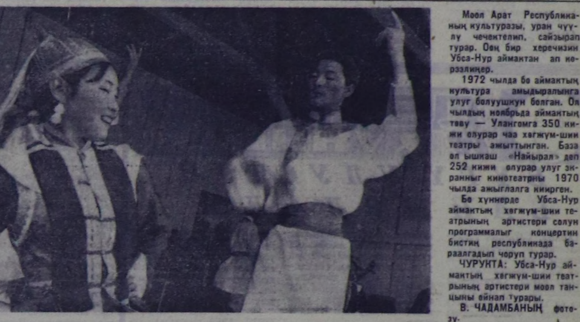
Моол Арат Республиканың кудулугу, уран чүүү чечектелип, сайырап турар. Оң бир херечини Убса-Нур аймактан ак нөрдөңгөр. 1972 чылда бо аймактың кудулугу амдыралына улуг болушунуң болган. Ол чылдын ноябрда аймактын тыва — Улангома 350 кижи өлүрү чаз хөгжүм-шн театры амыттыган. База ол ышкы «Найырал» деп 252 кижи өлүрү улуг акынның кинотеатры 1970 чылда амыттылган кичирген. Бо хүнереде Убса-Нур аймактын хөгжүм-шн театрының артистери солун программалык концерттин бистин республикага баралаалып чоруп турар. ЧУРУНТА: Убса-Нур аймактын хөгжүм-шн театрының артистери моол танчыны өйнап турары.

ЧЕЧЕКТЕЛЛЕ диз алтымдаа бузулбас быжын улам-на бүзүрөп билдир алдым. Моол улус-биле кады мында бистин тутканымы заводдар, школалар, өскө-дө объекттер — совет-моол найыралдык бузулг тураскаалдары ол. Моол Арат Республика — социализм дем каттыштырылганын быжыг ашканынын бирээни болушан, келер үеде бүзүрөлдү бар чорурр. Оон орту чырыккамы болгаш дорт. Чечектел-ле, моол чурту!