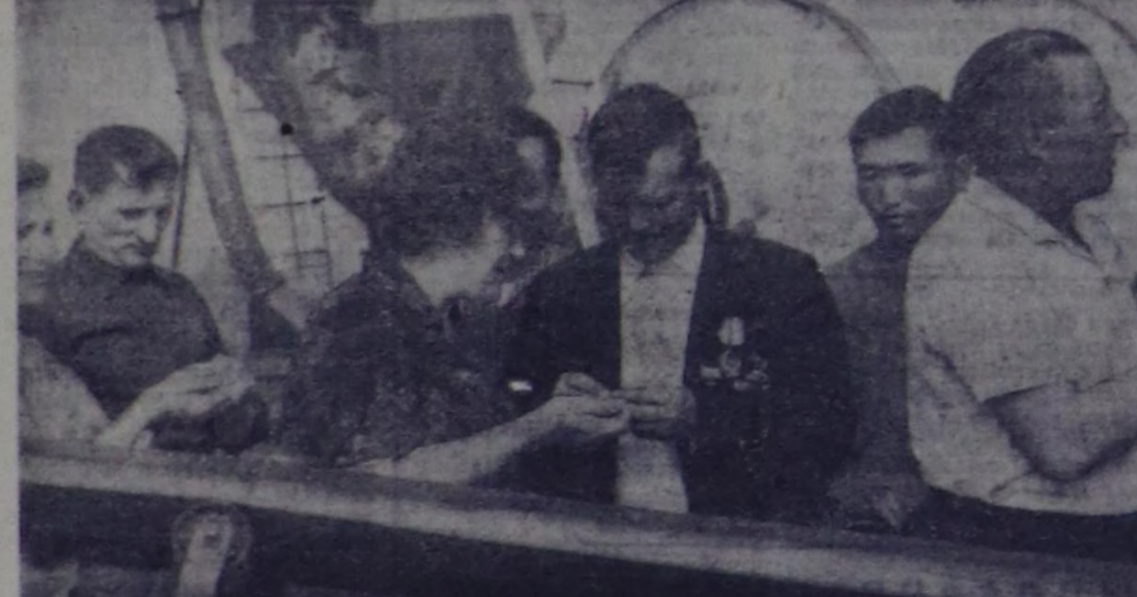
ЧУРУКТА: витаминизин сизен далганы болган борбаалыдаан чедеткелер агрегатты төлээлери күрүп турары.

«Московский» совхоз инитизин маалымат чедеткелеринин мурундагы технологиянын ажилдап турар. Анаа витаминизин сизен далганын буурур АВМ-40 деп агрегатты тургускандан бээр ийи чыл ажа берген.