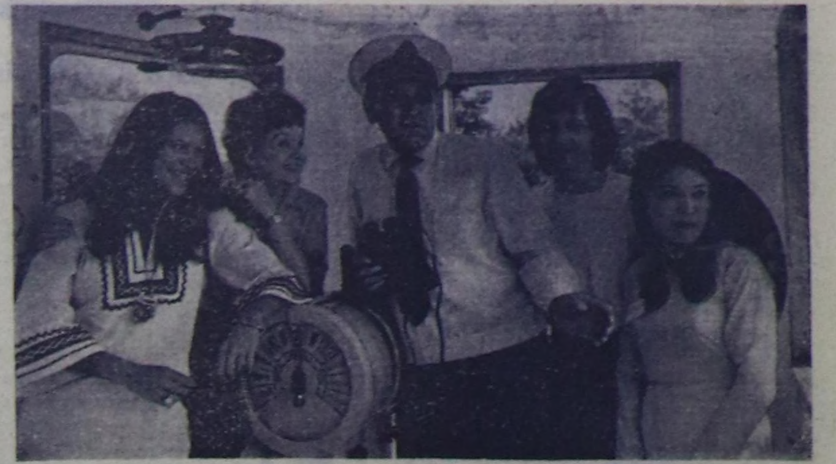
Делегейин IX Москва фестивалынын киржикчилери база аалчылары «Орджоникиде» болган «Чкалов» телехотодарга олурган...

ЧУРУКТАРДА: уругларнын танцы болуу моол танчыны ойноп турары; көрүкчүлөр.