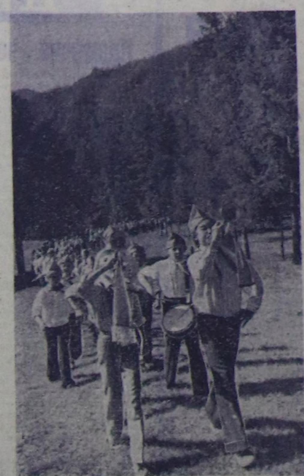
Ак-Довурактын даг-дүгү комбинатынын ажилчыларынын болгаш тулгуларынын школла чургалары чыны эвеш, көр-лүг эрттирп турар. Ак-Довурак — Абаза орууну 76-ты километринде Ак-Сүт хемини оң талазында комбинатын «Эзим» аттыг пионер лагеря 3 чыл улаштыр ажиллап турар. Мында ажилдап турар уруулар арыг агаарга, сугга, хүн караанга, бойбустан чагай аяныга даалыгып, жогайларын, музыка болгаш спорт ууртучуларынын дуузы-биле чаз ары, шулуктерин, оюнарны өренип ал турарар. Лагерьге бириг сезонга ажилтаннаарын ийги сезонунчур уургалары солган.

Уждуушкун башкарарынын Москва чогулган төвү.