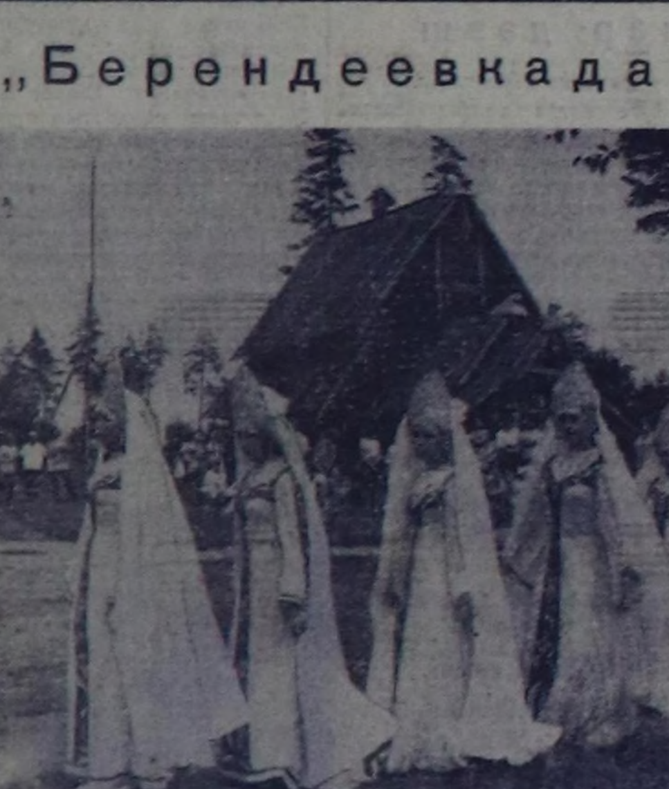
«Берендеевкада челээш» деп чоунун хоочун чогулганын чалгаш болган фести-валы Костромга болган. Ол байралага мул-мул көрүктүрүп чымылган. Бот-тыныгыр уран чугула 500 кире киржикчилери улут-тун ирларын, танымлырын күсөлдө-гүсөлдөшүн уран мергежилян көр-гүсөлдөшүн. «Берендеев оранынын» тоол-до-макта кирген тулгалары каастаан хоорай пармынын элээр кам илдеринге бот-тыныгыр артистер хары утга оюнар көр-гү-зүп турганнар.

Хандагайты. В. ЧАДАМБА. («Шынның тускай көрү»). «Берендеевкада челээш»