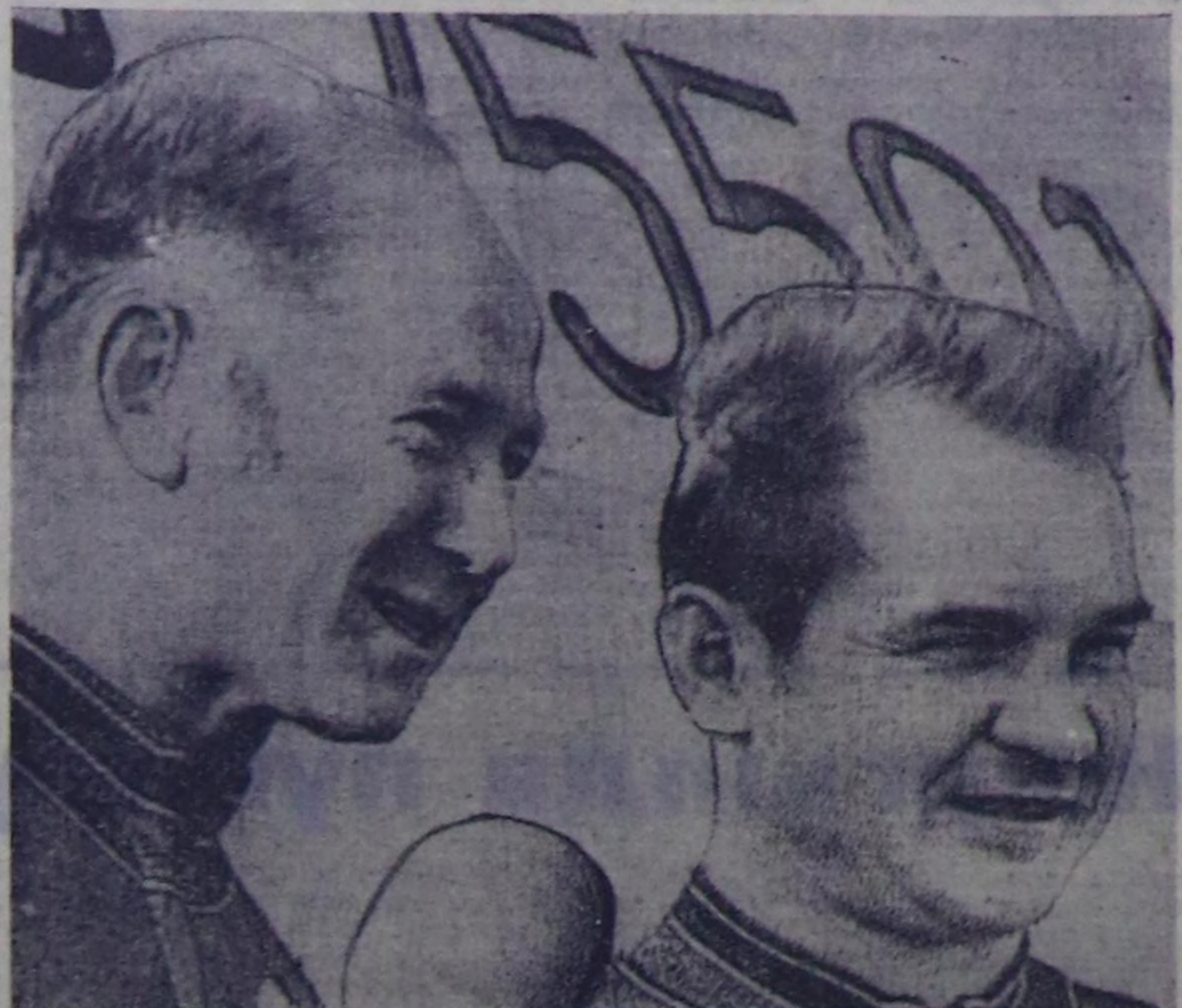
Космонавтылар А. Леонов биле В. Кубасов олар космостун «Союз-19» кораблин чөргө аяар кээп хонуканын соода Байконур космодромга келгенер.

рыш-Хемтик районун ажил-агыйлары улук кичээлгени салып турар. Алаа 6112 гектарга берга, 1200 гектарга ийги сугарылганы чоруткан. Ол ишкеш Чөвү-Хемтик, Улуг-Хем районларын колхозтары, совхозтары сугарылганын азын организастыг чорудуп турар. Иччалаажок бо ажилдын-лаа темпиз алажок оожум болуп турар. Өүр, Каа-Хем, Эрзин, Төс-Хем районларын ажил-агыйлары чайгы сугатке кичээлгени кошкаткан. Иччанган суг чөңгөр хиреде-ле бо райондарда сугарган тараа шөлү эвеш болуп турар. Шалыпчы айдын төнүзүңгө чедир артык хонуктарда куруктурга аңдарылганын, чайгы сугаттын планин оопадаларын бүрүн күөседир дээш, ажил-агыйларын удур-туктулары, тускай эртемчилер бүгү-ле болдулар аргаларын амылаар, ажилды темпиз бедлээр херек.