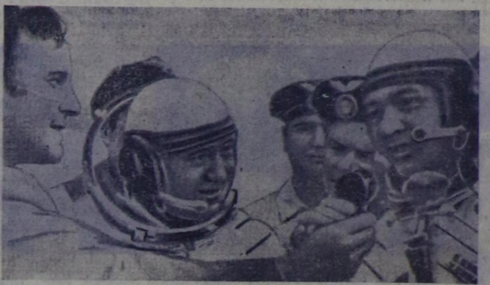
Июль 21-де Москваны-биле 13 шак 51 минута турда А. Леонов биле В. Кубасов оларны байкылары космостун «Союз-19» кораблин Казахстаның деңгээлэринге, Аркалык хоорайның сонгу-өөн талазында