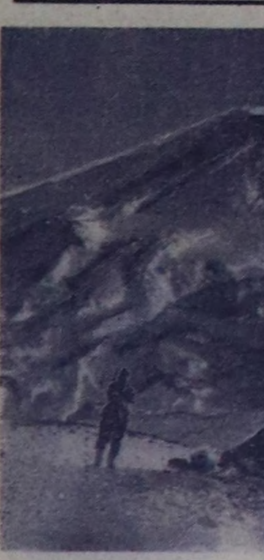
КАМЧАТКА. Евразияда от-козу чабышталып үнү чыдар улуу вулкандардын эң бедни Ключевон вулканы кайда-даа сура...