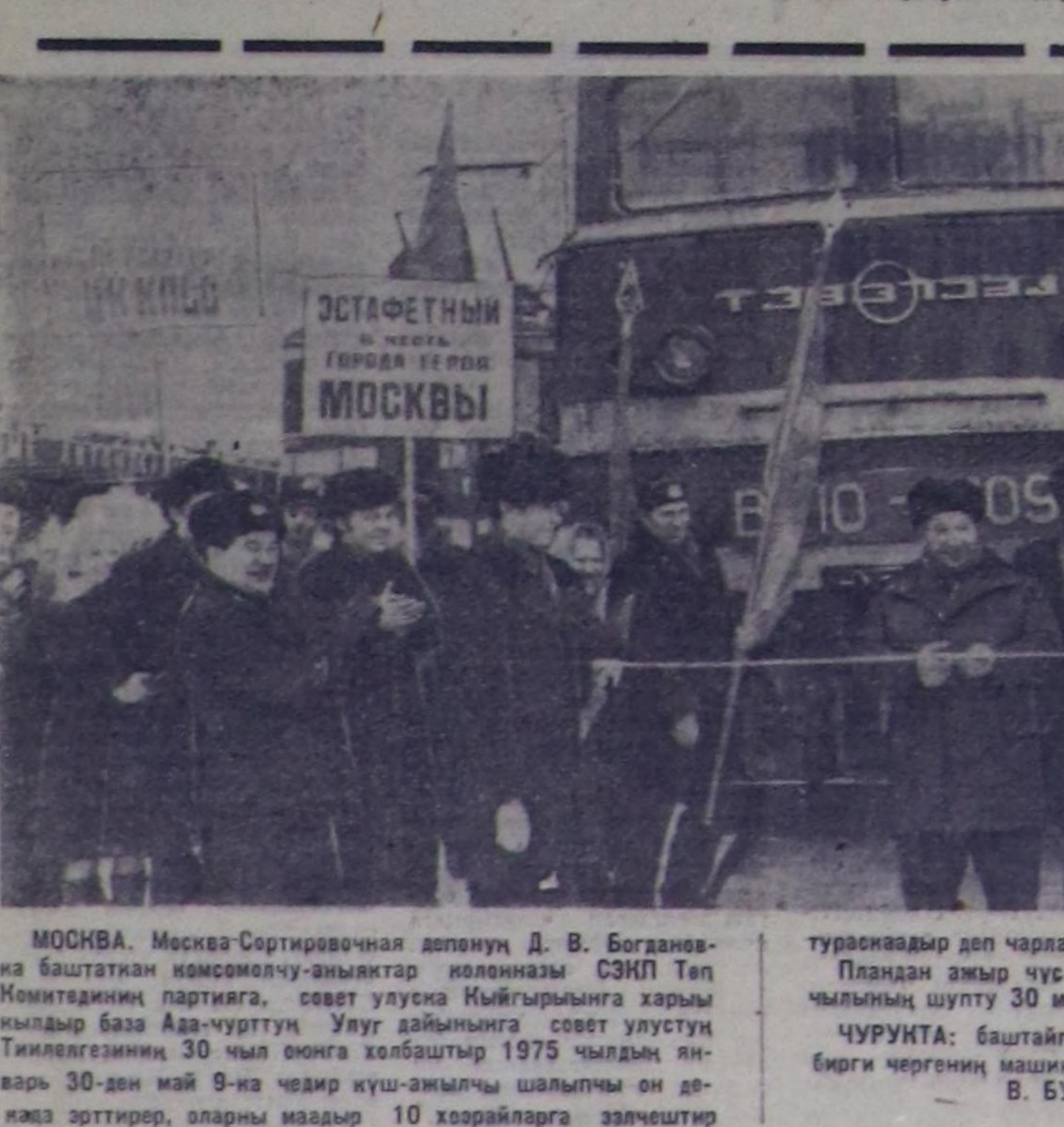
МОСКВА. Москва-Сортировочная депонуң Д. В. Богдановна баштаган комсомолчу-аныяктар колонназы СЭКП Төл Комитетинин партияга, совет улуска Кыйгырымды хары...