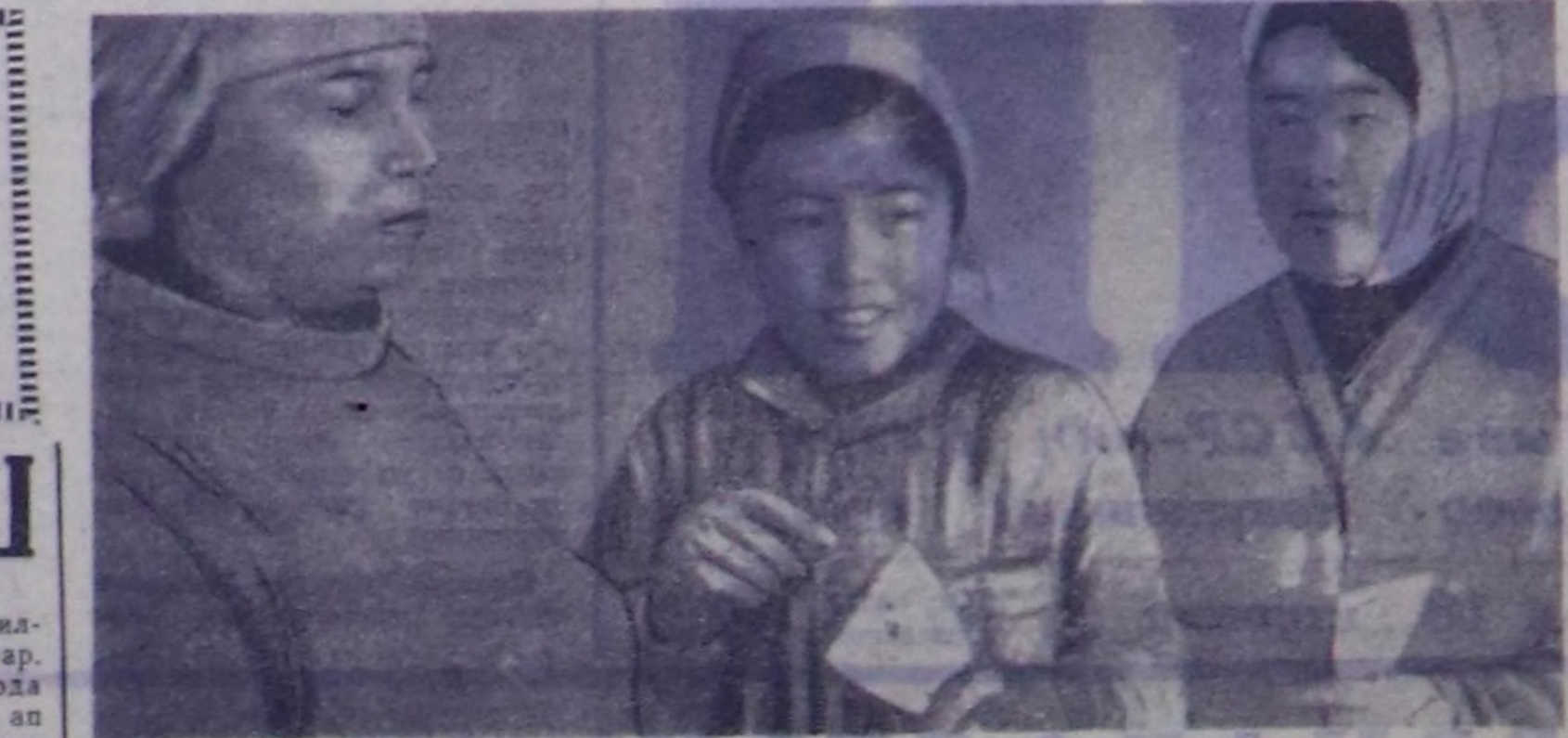
№ 48 тулгу эргелелинин шеверлекчилерин бо хүнерас найысмага Кызылдың Магистральнай күдүмчүзүндө 60 квартиралыг чуртталга бажымынын шеверлер ажилын доолун турар. Мында шамлыкын күш-ажыл хайымкан. Ылангыя профбөлүктү организа...