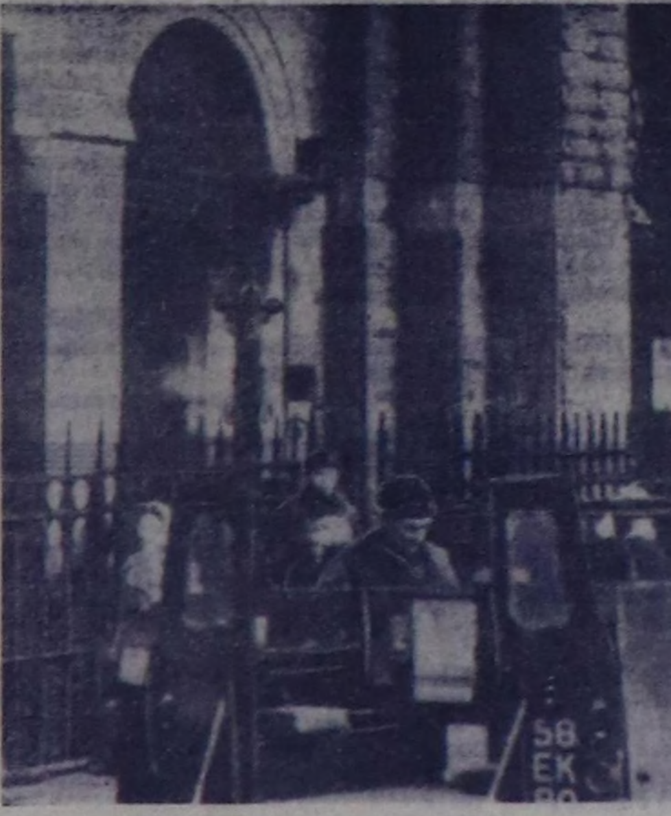
СОҢГУ ИРЛАНДИЯ. «Хөйлу дүрүмү болгаш көрүм-чүрүмү» тудары деп чыл-дак-биле Соңгу Ирландиянын хоорайларын-да шериглер доктаамал таңныылдан чөрүп турар.

Пномпеня дойдандыр, кам-гала шугуму дургаар шын-гы туудушукчулар бооп тур-гар. Информатия агентиле-ринин диндагы баугаар-ламыра, пномпеня команды-лапта дьргө күш, техника бол-сазып аш-чөм дажк чедипше-тээ. Ол чөриң хайгаарачы-ларнын бодал турары-бисе-