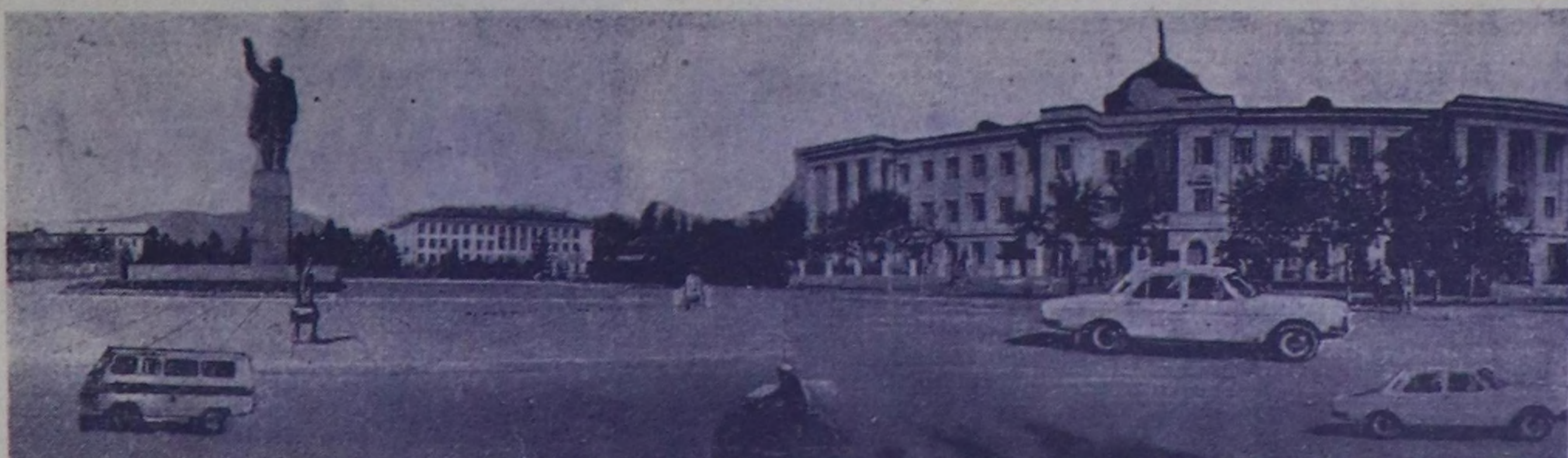
Найысылга Кызылда В. И. Ленин атты иш.

«Шын» солунуң бежен хары-лааны-биле байыр чедирип тур бис. Республиканың экономика-зының болгаш культуразының улам-на чектелешкини дээш демиселге, ажилчы чоннарын коммунисттик езуга кижизидеринге, СЭКП-ниң XXV съездилеринге адал болурун саала-тырыг чөп-чаа чогаалдык чедипкинерин болурун редакцияның коллективинге, автор активинге күрээдиң. ССРЗ-ниң Журналистер Эвилелинин баштаар чери. «Шын» солунуң бирги номери үнгөн хүнден бээр 50 чыл холбайтыр солунуң ажилдачыларына, ажилчы болгаш нөддө бижикчилеринге, бүү номчукудуларынга «Труд» солунуң редакция коллективин, бистик бүү коллектив изиг байыр чедирип тур. «Шын» солун республиканың ажилчы чоннарынын шагдан тура эки өвүңү, сүмөлөкчизи болу берген. Совет эрге-чагырганың чыдарында Тываның чогу Коммунисттик партияның ууртуугазы-биле экономикага бол-гаш культурага үндөш чар-тылгаларын боттандырап, амдыралды социалисттик эгел-дере бүүрүн-биле эле тургус-кан. Ол бүү чедипкинерин чедип алдырыгчы сыяларын сол-дунуң база улуг ролю ойнан. Пролетарияк интерна-ционализмниң принциптеринге шийги болурун бедик идея-линин үлөгөр-кижээ ол боду-нун бүү ажил-чорудулганы-биле көргүзүп келген. Солун редакция коллективинге, автор активинге коммунизм тургузар дээш демиселге чаа-ча чогаалдык чедипкинерин күрээдиң. «Труд» солунуң редакция коллективин. «Шын» солунуң чогаалдык коллективинге, автор активинге, бүү номчукудуларынга ча-зактын бедик шаңналы дээш чүрөктүн ханыннан дээш байыр чедирип тур бис. Совет Тыва-