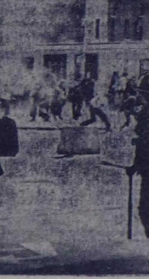
холбаштыр католк эвөп кезининч төлөлекчилерин кылган чыккалычыче протестаны ажыкчаларын халааларын соода ол можуа дүвөрүзүнн байлаа катеп эгелен. ЧУРУКТА: Лондондеринин күдүмчуларында сегиржи алдымыкынар.