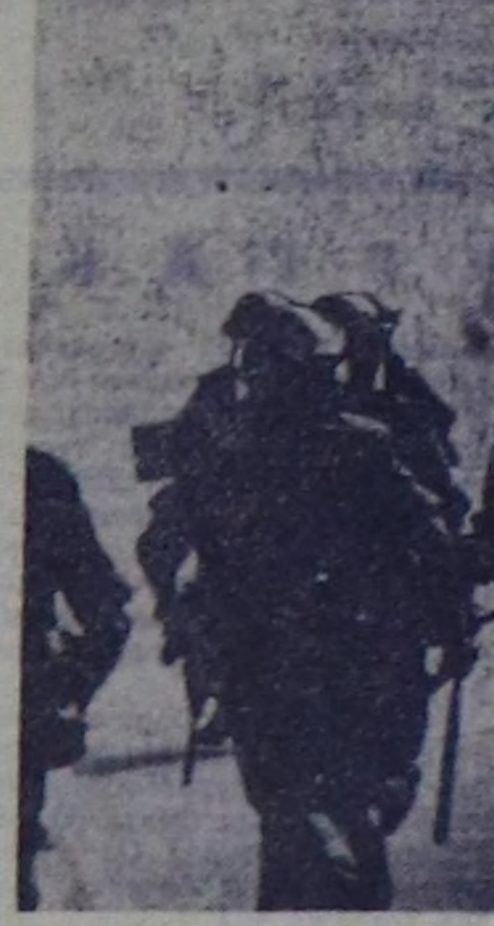
Сою Ирландияда байла дүнүктүрүг болушана. Беафастага болган Лондондерге протестаны улагың чаргы шөргө организацларынын кезиктиривик өскү-көчө боо-чөксөктин сегирин алымыкынар болушана. Олурткен болган бадылган-даа кижилер бар. Интервьювание дугайында хойбулуку күштүг бооп эгелээнинин 4 чыл өкө-биле