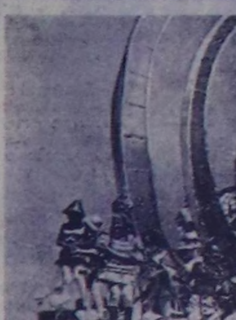
ЧУРУНТАРДА: Гаванада карнавал чыскаалы.