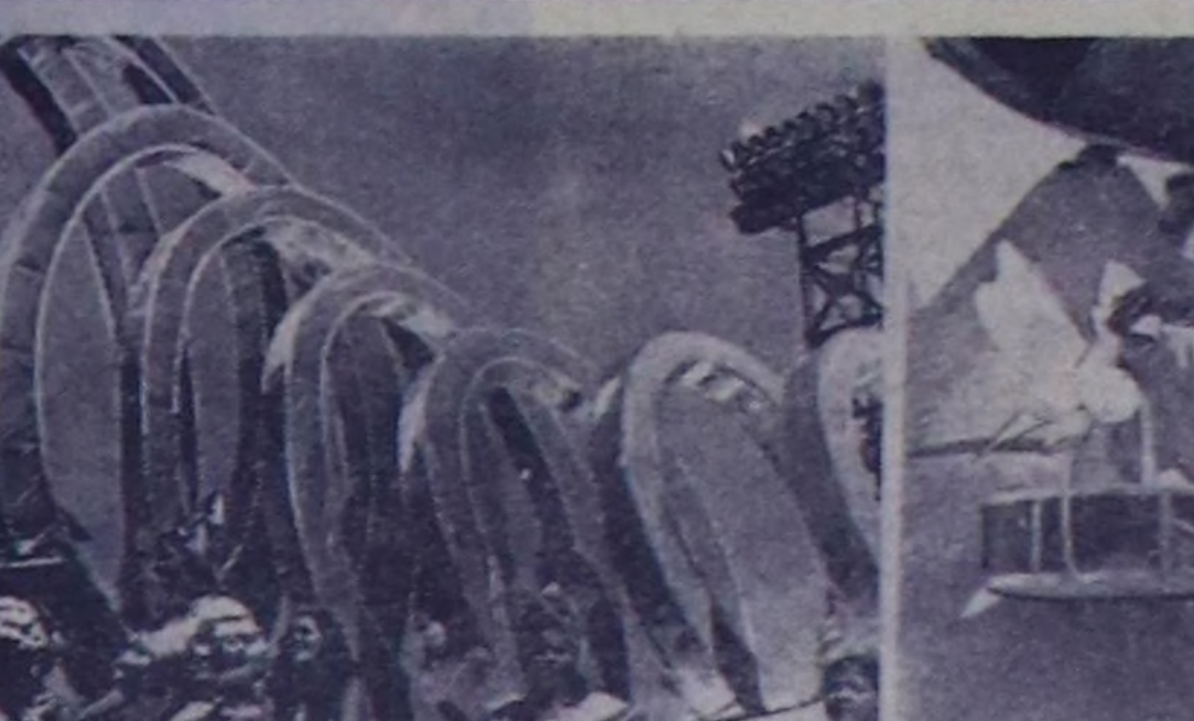
Кубада чаңдык болган карнавал чыскааларының болгаш чонуну селүүтөшкени-неринин үези — чай кидин түлүк. Гавананын болгаш өскө-даа хоорайларын кудумчу-ларын барабаннарын, труба-ларын болгаш лимбилериниң үнү долган. Кудумчулар тава-рып байырлаалын киржики-лери музыкалтылар болгаш тамчычылар олтуруп алган хөй кат тергелер оожум эр-тин турарлар.