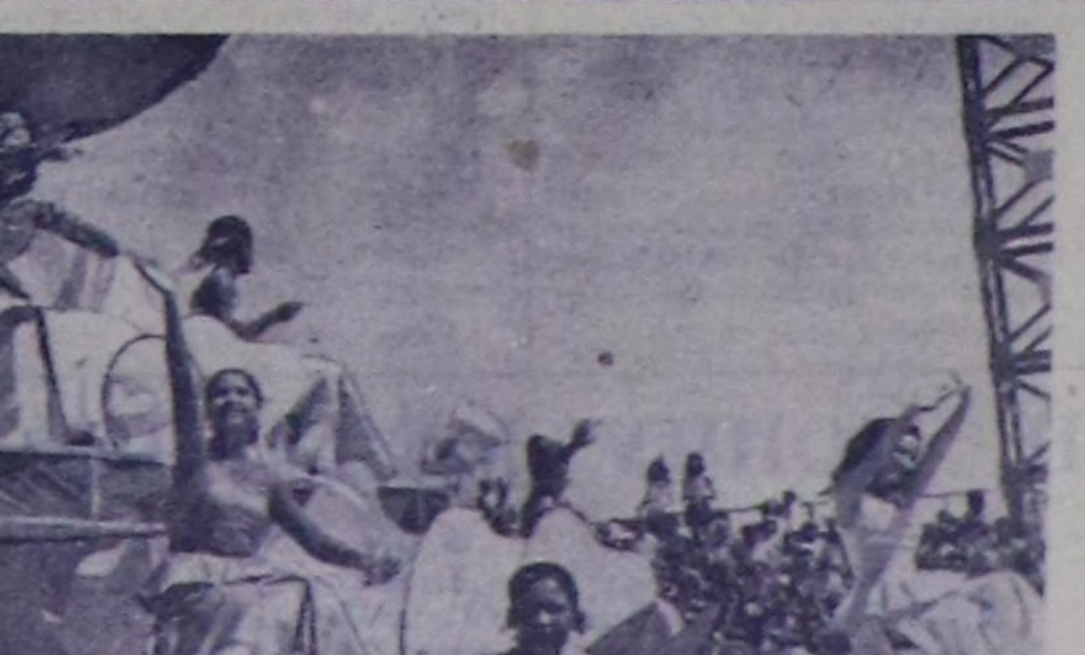
Кубада чаңдык болган карнавал чыскааларының болгаш чонуну селүүтөшкени-неринин үези — чай кидин түлүк. Гавананын болгаш өскө-даа хоорайларын кудумчу-ларын барабаннарын, труба-ларын болгаш лимбилериниң үнү долган. Кудумчулар тава-рып байырлаалын киржики-лери музыкалтылар болгаш тамчычылар олтуруп алган хөй кат тергелер оожум эр-тин турарлар.

РЕДАКЦИЈАНЫҢ АДРЕЗИ: Улуске 667 000. Кызыл Шетинин-Бравченко кудумчузу бажын № 3 ТЕЛЕФОНАРЫ: Редакторунуң 24-63 редакторунуң ораакчыларынын 35-24 квалдизини 31-75 харымсалгалы секретарыны 23-35, сартигы амыл мрал квалдизини 37-13, культура квалдизини 23-54, амыл квалдизини 21-47 үзөтүр квалдизини 23-64, чагаа квалдизини 41-27 информатив база совет тургузут квалдизини 20-60, харын 27-41 бугалтериянын 50-22 солуг келбеди баарга 32-75 телефонче долтар.