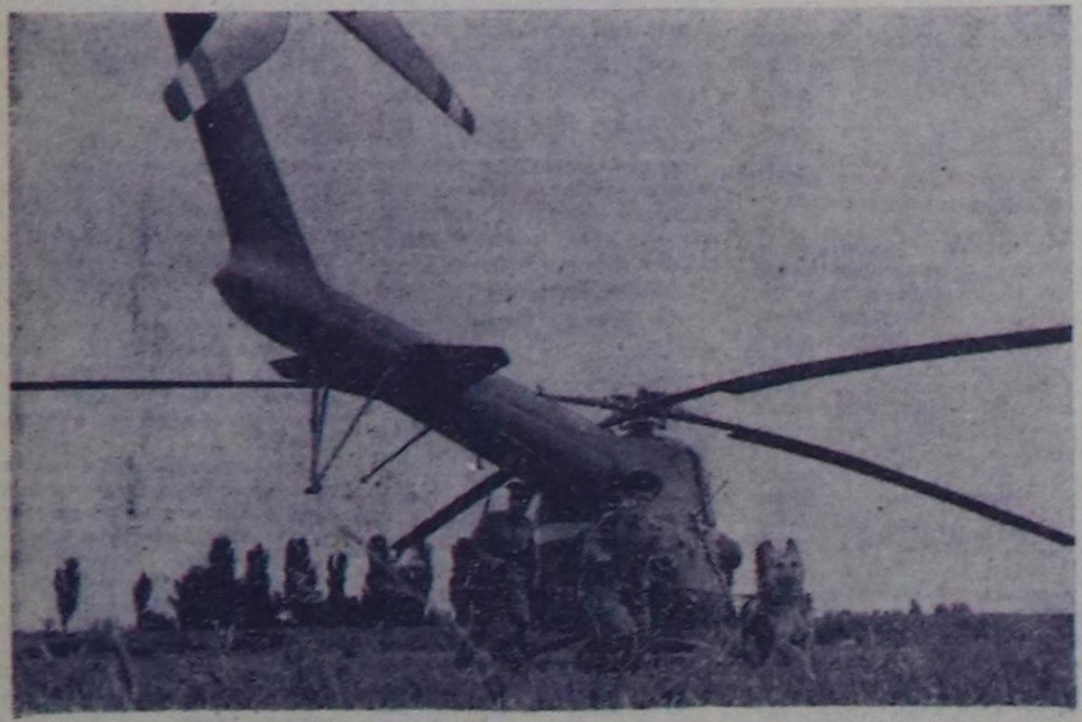
Кызыл тукут Барын чүк кызыгаар окурутууну И заставанын дайынчылары боттарды дайындай техникалык болгон чөпкөктөрүн терини эки шпиддин алганар. Заставада алгын-алгын националдык оюндар албан эрттери туралар. Олар шу-