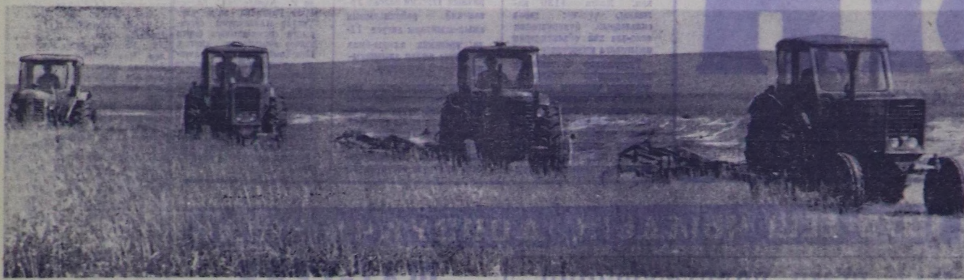
Бригаданың сизген кестирер звеносу ажыл үзүндө.