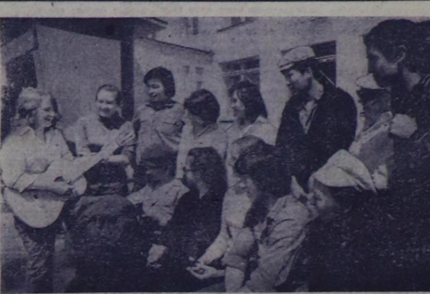
ЧУРУКТА: Кызылдын № 15 школасынын Дардан бөлүү-биле кады ажылдап турар школачы- лары.

Кызылдың № 15 шко- ланын өөреникчилери Тыванын геология-шынчи- лел экспедициясының партиялары-биле кады ажылдап чоруп турар. Барык ийн чай улаштыр урууглар геологтар-биле кады чоруп, солун чүүл- дерин билди алганнар. Бүдүрүлгө планын күүсе- диринге олар үлүг-хуузун база киирип турарлар.