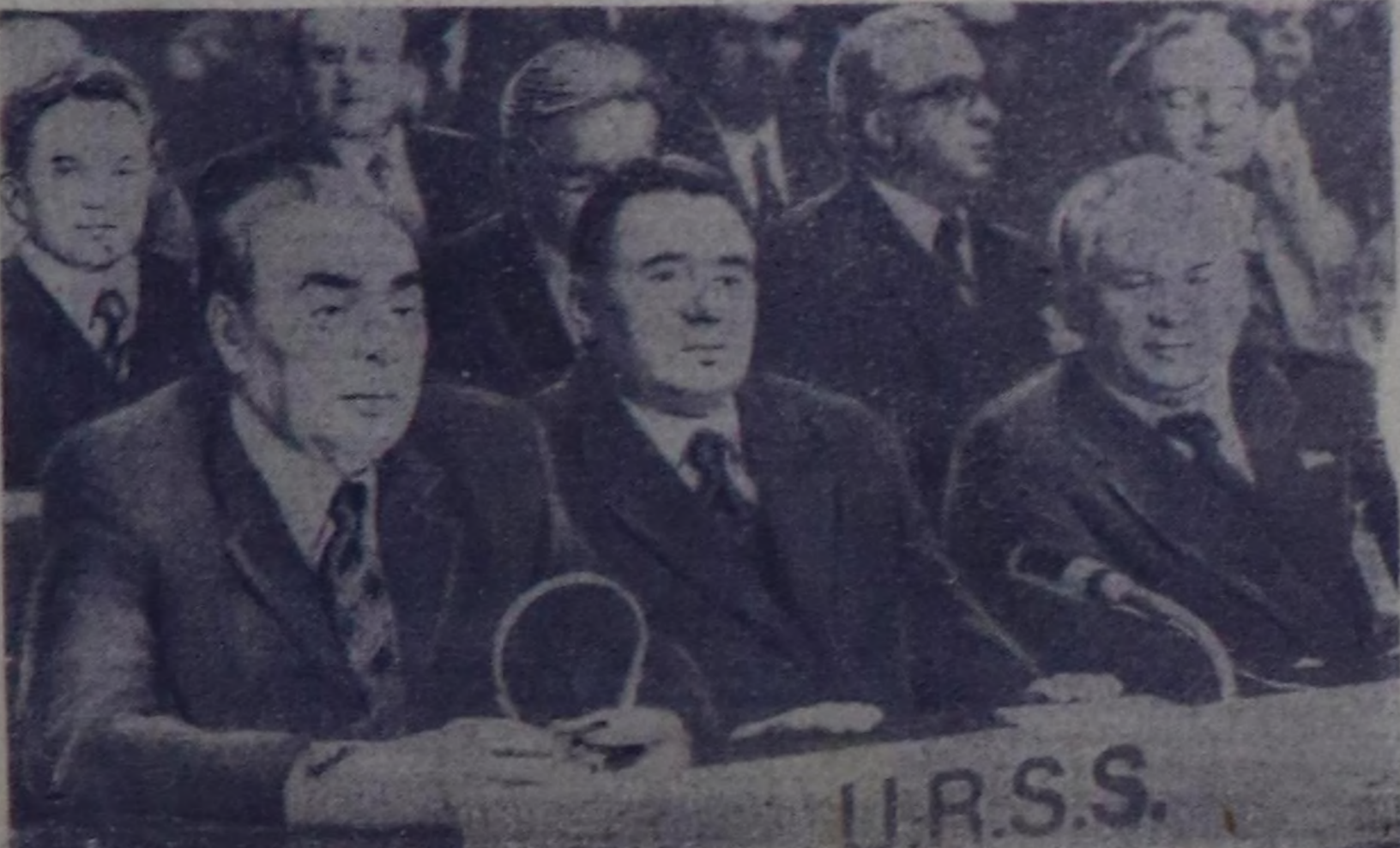
ЧУРУКТАРДА: солгай талазында—совет делегация хуралдаар залда; оң талазында—Чөвүлел хуралдың ажыттынып турганынын үези.