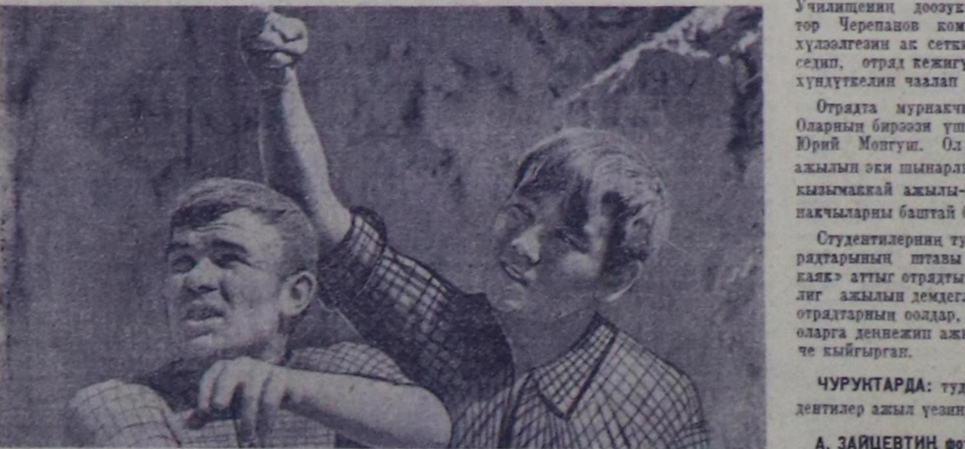
ЧУРУНТАРДА: тудугжу студенттер ажыл үезинде.

Студент тудуг отрядтарынын мурунда салдыган көл сорулга чыгыт бөөр төп магистральны тудушкунун доозарына дузалаар болгаш ову хоорайны чыдылгача четкизиңге улаары болур. Бө үлө-хө-ректе Кызылдың башкы училецениң үш тудугжу отряды шылтчы суу-биле ажылдап ту- рар. «Кымыскак» аттыг отряд школа-интернатын бажы-нын чыгыт бөөр трассага чы- лыгы алып кылдыр тудушту- рар. Келир үениң башкылары 300 метр черге бетондан кут- кан тавактарын салып, улуг хоолайларны тудуштуруга- нын, нарын шымышкынын шылткын кылып турар. Чар- дынган керээ- суугаар өлү ар- дуг 15-не чедир доозарын хү- лөнгөткөн. Иччала-даа күш- ажылыга тура-сорукту, хү- лөнгөткөн күүседип шыдаар та- лымы эрлер чыгыт бөөр шугу- ну август 1-де доозар дугаймы- да бедиктен хүлөнгөткөн алгаш, сөглөн сөзүн ажыл-хөрек кы- рынга бадыткаар дөөш күжө-