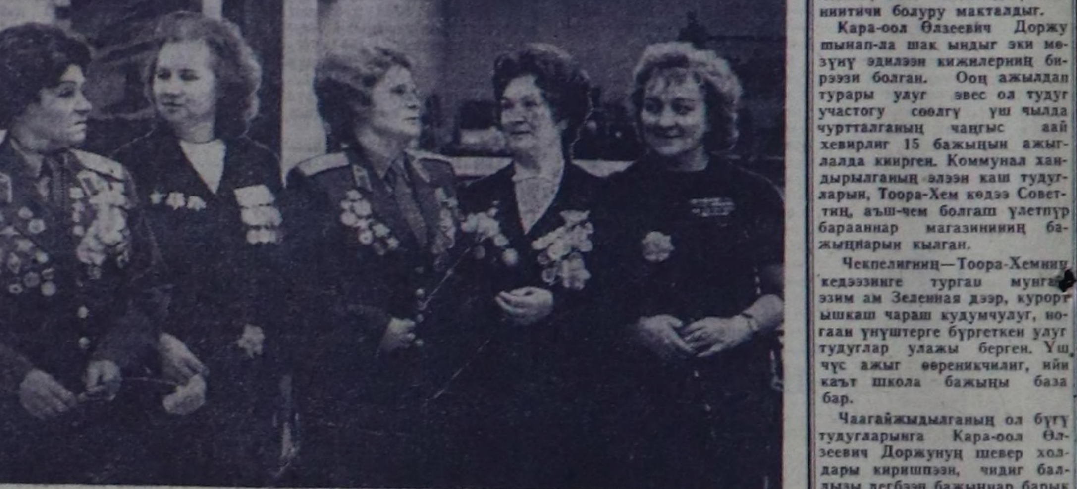
Ада-чурттуң Улуг дайынның кадыг-дошкун болгаш алдаржы сурагжаал-даа болушкуну тевтүжө улам хама-ла, мрак бар чорур. Ол аар-берге чылдарга херэзжен кижилер боттарынын фронтке чоруккан апартары болгаш акмааларын күлге талаш салып, оларнын орунуга ажылдан турган эвес, харины база өргөткөнүгү-нүгү калып Төрөн чуртту чыгыс оодуртуу туржун, камгалан турганар.

Таманын Кызыл Туу болгаш Суворовтун III черезинин ордендерин ужуз чулууду гвардейки 46 дүрүлгө херэзженне поугу фронтка маадырмын биле демисекип турган. Ол полку 1941 жылда бүгү чуртка сурагжы ужудукчу, Совет Эвилелин Маадыр Марина Раскованин сайлаан сурагжы турган. Ол полк белен эвес, алдаржы дайынчы орукту чаркы ол Кавказга камгаларына, Кубанын болгаш Тамань артык ортуку гитлерлерден хостарына, Крым дээр, Болоруссия дээр төөгүтү тулушкунуна, Польшанын хостарына болгаш гитлерлер ал-гершиин Германияны демисекирине чыла шаарына-даа кирип турган. Ол кезекте дайынчылар дайынның боо-чөсөөн болгаш ок-чөсөөн кадалгаан чус-чус сквадтары буза төвсикен, чус-чус хем кезиктерин болгаш от точкалары узуулап, дайынның туртуштарыне муң-муң ужудукчулары кылган. Ол полку дика хей ужудукчулары болгаш штурманыры шыла-рагга маадырмы чорун көргүзүп турганар. Оларнын Чөрбө ужуге Совет Эвилелин Маадыр деп бедик атты