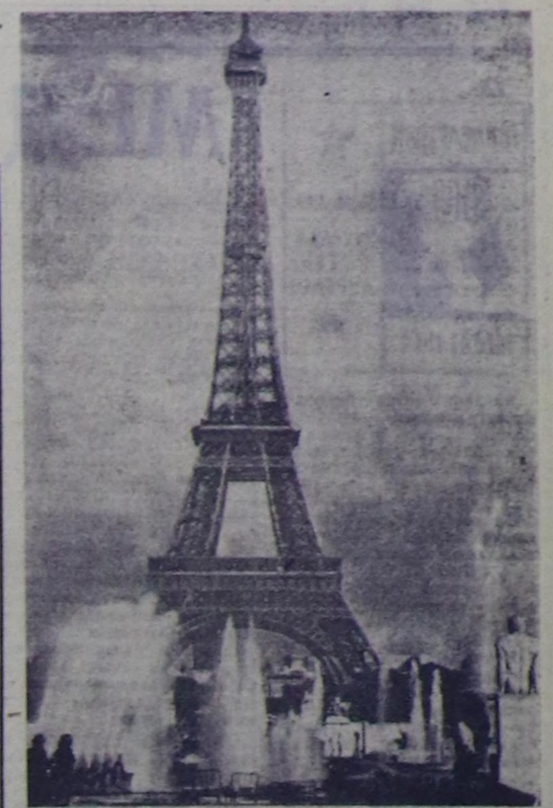
Франция. Сенаның эркинде Парижтин Марс шауяна Зифель суургазы дээрме шаштыгып үне берген көстүп турар. Ону 1889 чылда францун инженер А. Г. Зифель Парижте болган дөгей дегелгезинге XIX чүс чылдын техниказынын чөдийшкенинде демдээ кылдыр туууп тургускан.