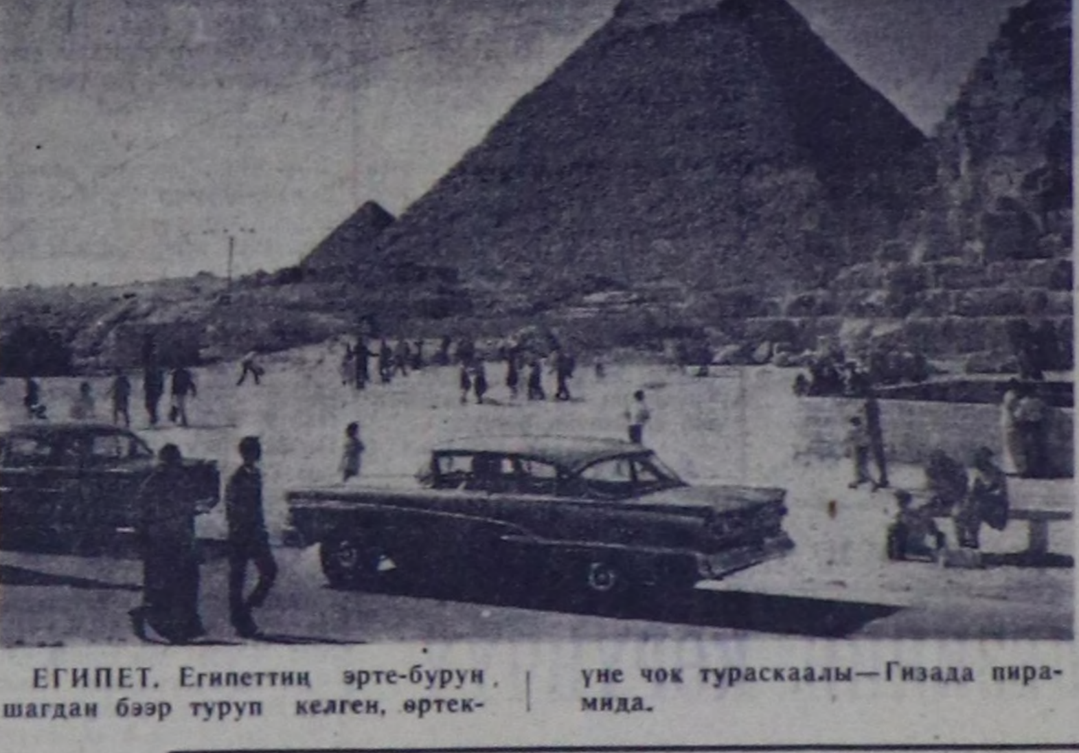
ЕГИПЕТ, Египеттин өрте-бурун шагдан бээр туруп келген, өртк-үне чок тураскаалы—Гизада пирамида.