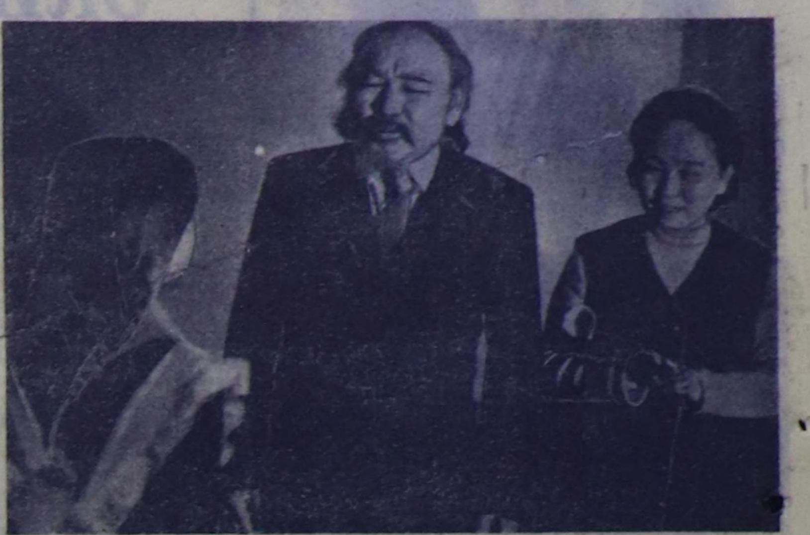
уре-түшөлдиг ажилдары... уре-түшөлдиг ажилдары...