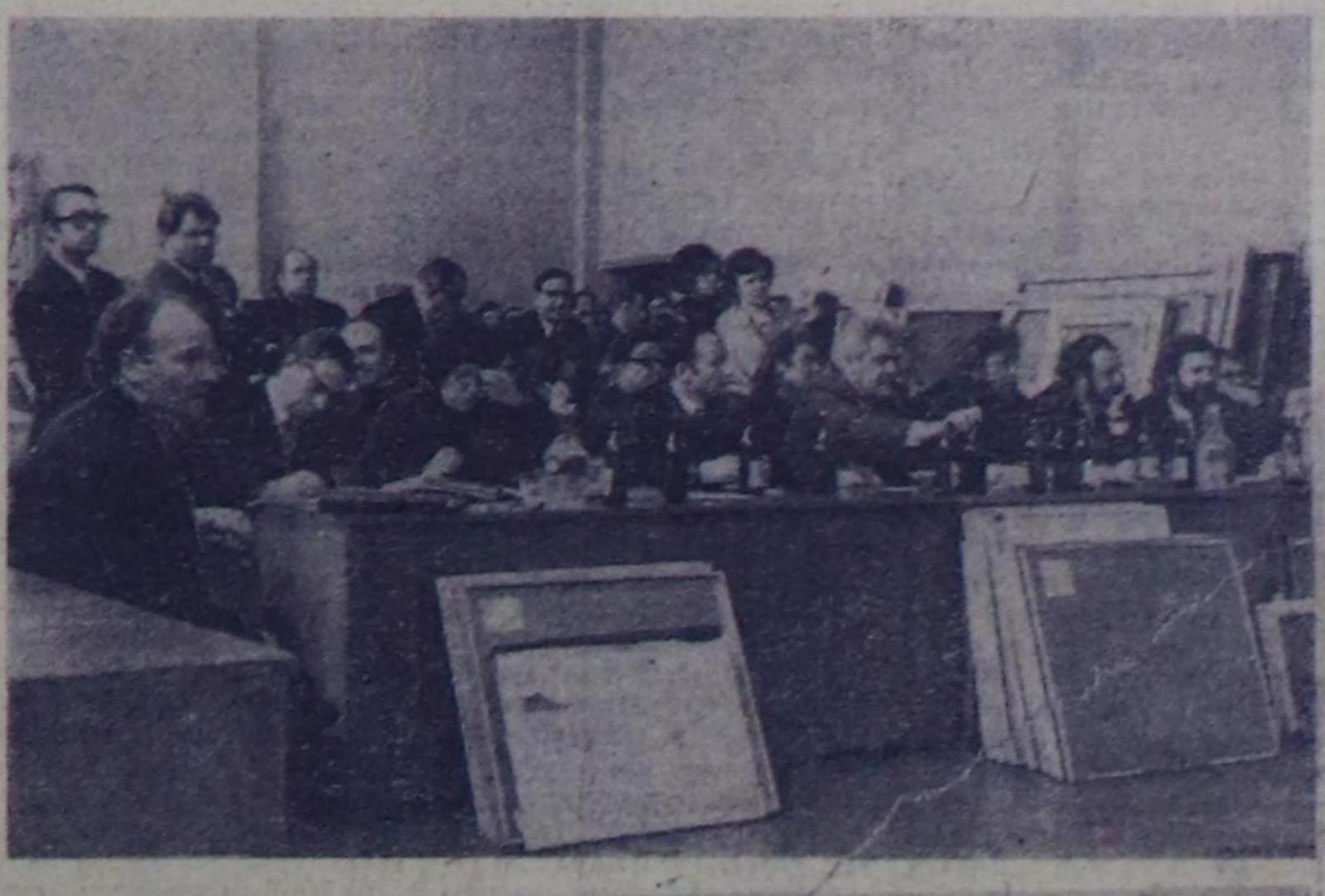
ЧУРУНТАРДА: Устунде «Социалистик Сибирь» делгелгени комиссиясы шиллге үезине.