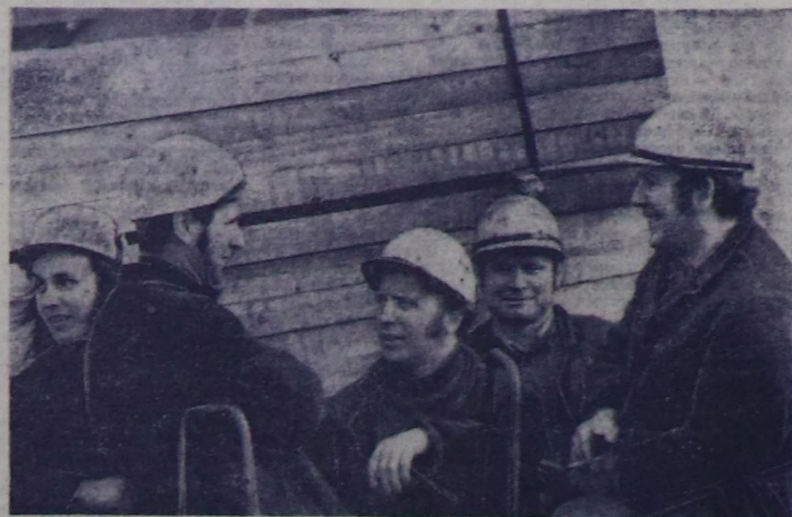
ГДР-нің Балтикада эң улуу далай өртээли Ростоу республиканың кол далай хаалгасы. Делегейиң хөй-хөй чурттарына баар чугула салыг оруктары оон эгээр. Далай өртээлиге чурттуу улус ажил-агыйының хердегээр чурттары чедирин келер чус-чус судно доктар.