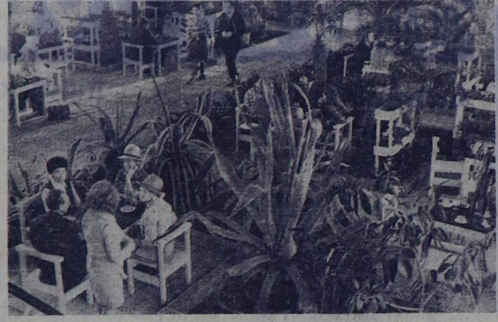
Тыва артистерниң чедишкени