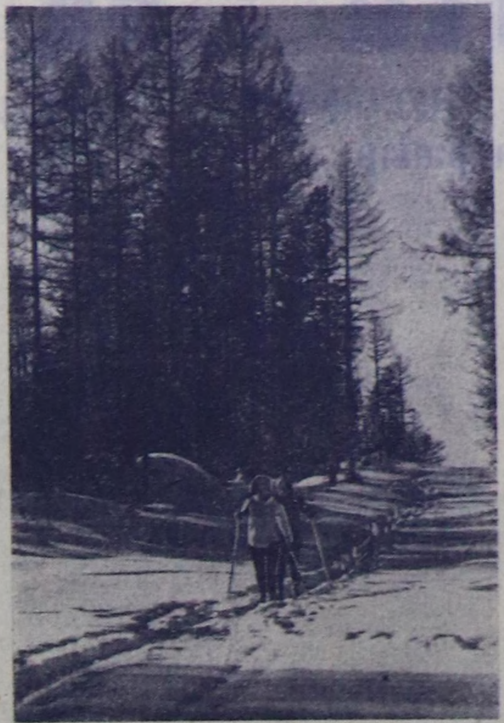
«Төрөн Тывавыстың делгемнеринде» деп фототүзүтүгү Г. СИРОТИН тирттерген.