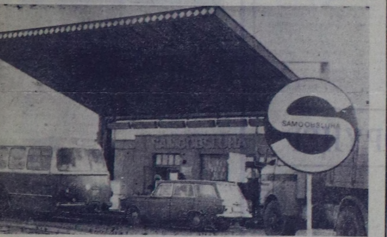
Социалист Чехословакиянын орунтарыга аржыр автоматиналар санымны көвүдери дүргөдөн. Ынчангаш ам оларга техникти амыл-иш кылып бээриниң четкин калбарыны эргежин чугула аларган. Келген чалаачалыр хергелген ынавар чазар материалдарын боттары нуадул алыр бир станция Нимбури хоорайда ажилтынган.

Араб чурттарга улур эжелекти дайын чорударыче Израильди Барыны чүтүкө Ифтирик бөдүктери күтүп каан. Ам боттарынын ол политиказын балалыг уржукту чөгүм-на олар таваржыр турар деп чүведө ханы ажур-ла бар. Дагышкы чурттарынын нефть монополияларынын Иракта, Сирияда, Алжирде, Ливияда хошкучуларияда бурнуу-биле ийлек кезик чамалыктап национализиацияны, Иранга бүгү нефть-тывыш улустурну күрүне контролонга алганын болгаш нефть казар өске-даа чурттарга нефть компанияларынын ажил-чорудалганын контрольдарын күштедиргениниң сонда нефть монополияларынын туруштары оранчок кошкан. 1973 чылдын сөөлүг алырында оларнын туруштарына шымырак согуштары куннары база катан таварыштырган. Чоокку Чоон чүтүкө октябрда болган дайынын сонда хей-хэй араб чурттар нефть тывышкыны кызыгаарлар болгаш ону АКШ-ка, Голландияга садарын соксадыр хемчегелерин коллективти алырга, чүтүлгө экономика-га хамаарышкан өвөс, харыш политиказын улут түннелдерин болган.