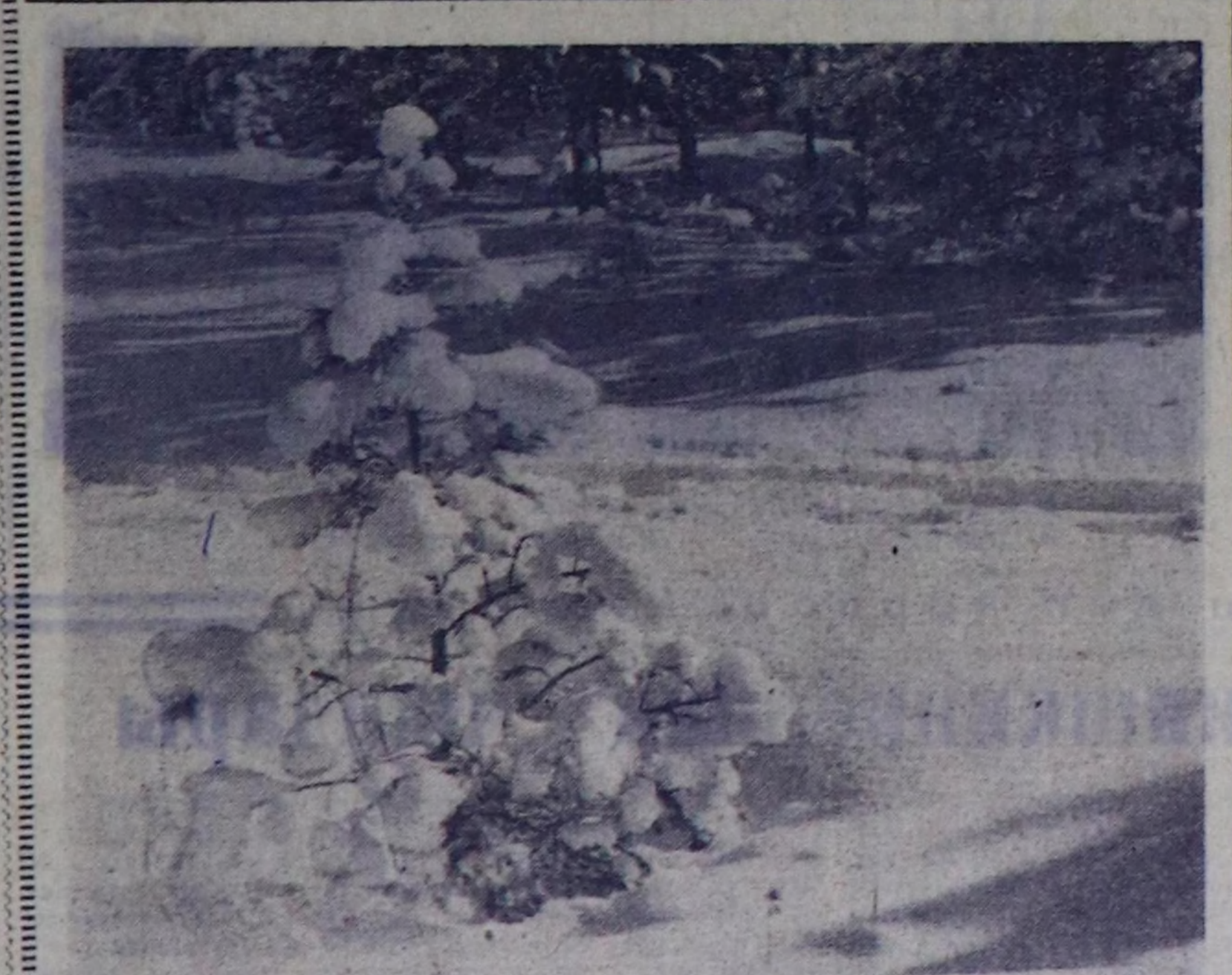
НЫШНЫ АРГА. А. СОДУНАМНЫҢ ФОТОТӨДҮ.

Бистин республиканын кал-бак-делгем девенкэринде кан-дыг агмен, кандыг байлак чоң азарал. Тожуучу Олуге-Тайгалында азырал ивлер-биле турисчи маршрут болур. Оон бир хереван — чы-лымда Совет Эвизиленин бүгү булдунарында муң-мун ту-ристер Тыва чурту-биле та-ныжар дөш көп турары.