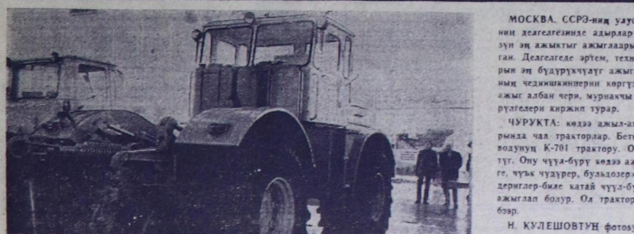
МОСКВА. ССР-ниң улус ажыл-агыйның чедипшинеринин делегелешкен амырлар аразының «Черниг гектар бүрүзүн эң ажыктыг ажылгаары» деп темалыг делегелге амыттыган. Делегелде эртем, техниканы болгаш чер курлавырларын эң бугурулуздуг ажылгаарынын мурнакчы дуржулазынын чедипшинеринин көргүзүп турар. Аңаа эртемнин 200 амыг албан чери, мурнакчы 350 колхоз, совхоз, улестүр бугурулуздары киржиң турар.

Беш чыл планынын дөртү чылын СЭКП-ниң XXIV съездинин шийтирилсин күтүскенге чаа-чаа чедипшинер-биле демдегелээр дээн партияның кыйгырынга харылаашпаан, Тыва АССР-ниң ажылчылары, колхозчулары болгаш албан-аажыкчылары тоску беш чылдың тодарыкчы чылы—1974 чылда дараанында социалисттиг хүлээлгелерин алган.