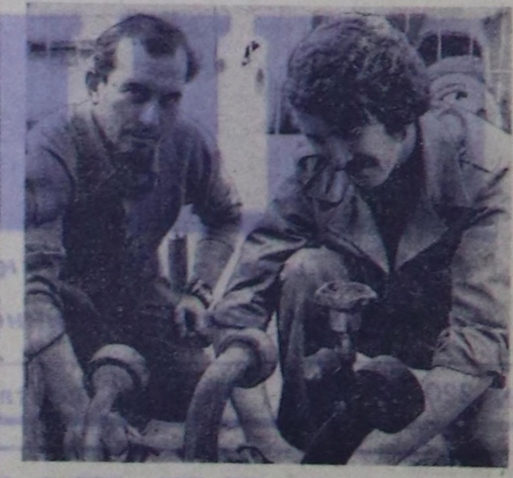
Чоокта чаа «Тыва газ» бугурулге эргеледи чырым, делгич болгаш эргежок чугула дериге-биле хандырылган чаа ийи кат бажыңче көшкө.

Совет Тываның 30 чыл бо-лур оңи күш-ажыкчы белеткээ-ринге үтүкүрү дээш «Саян» совхозтуң амыкшапчылары социалист чарышты дээштик организациаан. Совхозтуң малчынары бо тодарыкчы чылда эки көргүзүлгени чедип алган. Эт, сүт, дүк бугурурениң, оңи салдырынң планын амыкшап чедикшилик боттандырган. Эртенге чылдың бо үениңге деннээр ээтти 100 амык тоннага хөйүнү сатаан, ол мыкшап тос айларын сүт планы база амык күсеттиң. Дүк бугурун, сөдүрүнүң чыл планын амыкшап. Эртенге чылдың бо үениңге деннээр бо чылың 6 тонна эки шынар-дык дүктү амык дужааган. Совхозтуң малчынары чаш төл амык талаш-биле эки түн-неди чедип алган. Чүс баш төрүрү хойга онааштыр 82 хураганым совхоз ажаап-ап шыдаан. Сиген белеткээ совхозта 70 хуу челе берген. Ылангыч Сөсрели салбырынң мал чедип белеткээрин 350 тонна сөгүлү кедип, сарытаар планын күседир чоокшудай берген. Силос салымшыкын амыкшап үргүчүлүп турар. Бүдүр-гө чедир совхозтуң амыкшапчылары 1200 амык тон-на семизти салган. Сиген белеткээ совхозта 70 хуу челе берген. Ылангыч Сөсрели салбырынң мал чедип белеткээрин 350 тонна сөгүлү кедип, сарытаар планын күседир чоокшудай берген. Силос салымшыкын амыкшап үргүчүлүп турар. Бүдүр-гө чедир совхозтуң амыкшапчылары 1200 амык тон-на семизти салган.