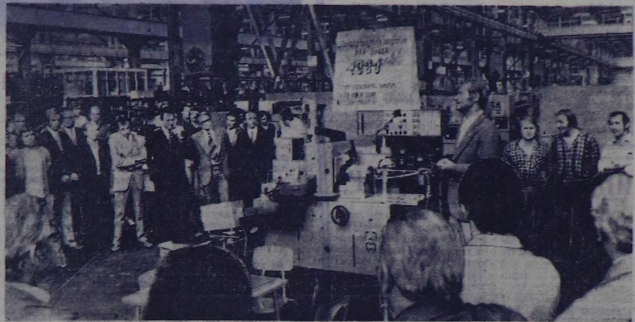
ГЕРМАН ДЕМОНРАТТЫГ РЕСПУБЛИКА. Берлин-Марцанда станион тудушунун заводу Совет Зелелинге бээр чоюлга...