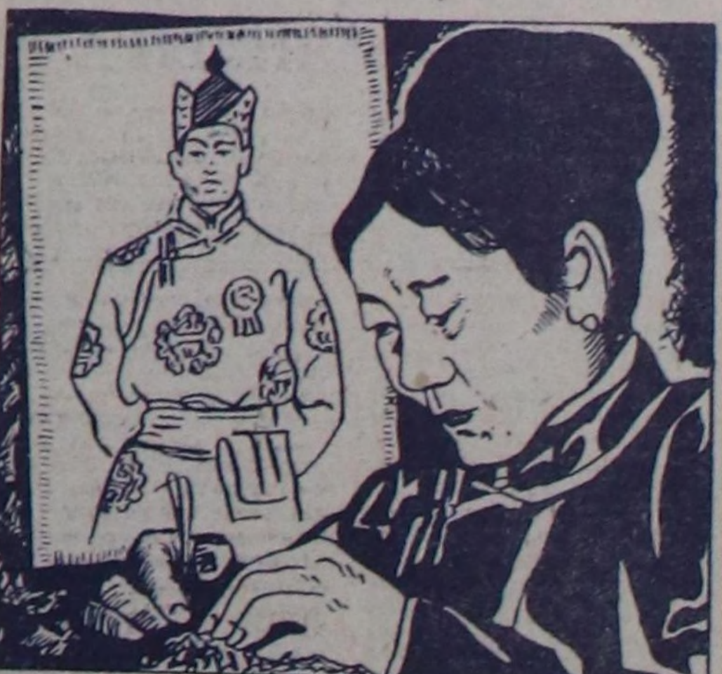
«АРГЫКЧЫ» МОНЦАМЭ-НИЦ «Новости Монголии» деп солдундан.