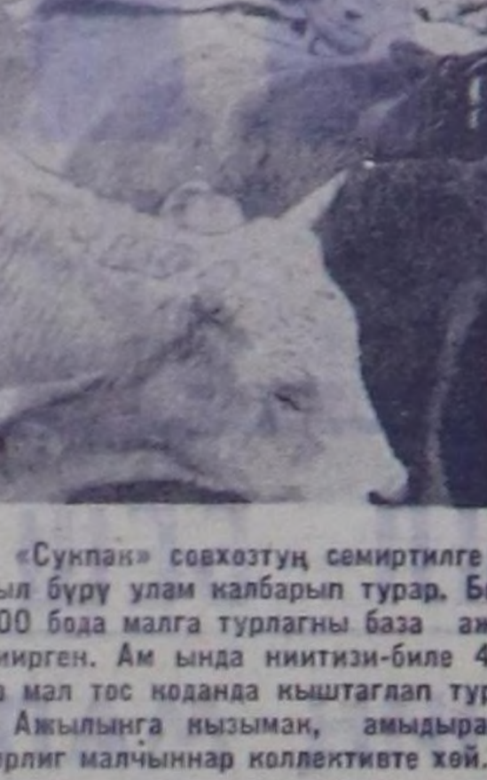
«Сунпак» совхозтун семитилге базазы чыл буру улам калбарып турар. Бо чылдын 500 даа малга турлагы база ажылаа кинирген. Ам чылда нитириг-биле 4500 бо да мал төс конада кыштагап турар.

мурнуна каш удаа тургузуп белген. Ыччалажок бо айтыр ама-да шитпирлеттиниз. Администрациянын ажил-чорудулганын контролдаар тускай комиссия чүгелени хмалдан чоруткан. Бо талазы-биле партбюро ук комиссиядан негелдени күштедирбазин чедик. Угуу бүдүрүрүге комиссия, профбиле болгаш өскө-даа хой-нигити организационларын ужуу-дугаан удуу. Ылалыга фабриканын ажилчыларын хой кезин доктомолдуулар болгаш аныктар. Комсомол ажилдына чедиктерин илеткеди болгаш санал бергенер чугаалаанар. Комсомолдуу ажил-чарыкчы, аныктарын коммунистик кичингетий партияжи кичингетийи угландырар ужуу-дугу. Фабриканын мурнуна ам удуу соруга — тодарыкчы чылдын шитпирлеттиниз дертук кварталын чедикширин доврак-дооузун, 1975 чылда даг-дугу арылгавар фабриканын илдин ээчеге ажилдакчы кинирине чедик ажил-инженерин күжү мөөнээр болуп. Илдин ээчеге туттунарга анаа барык 900 хире ажилчын төмөжир анаар. Амгы уеде 250 чаа ажилчыларын хулаон алган. Оларын тускай мергежилдерге өрөдип турар. Ыччалаш амгылаштан эгезин илдин ээчеге ажилдар кинирини шилди ал, оларын ажи-бүрү мергежилдерге, муракчыларын дуржулгазына өрөтөп болза, келер чылдын бергелер бээр дээр билдинир. Ыччалаш партбюро өскө хой-нигити организационларын камнаал бо айтыртын талазы-биле тускай ажилды чорударын чугулаан отчёт-соңгулдарга хуралга демделген. Бо күн-ажылчы удуу коллектив коммунистерин отчётту хурал ажил-чарыкчы байлаа эртин, чедип ылдыртып чүдүрүн илердин, мөөн сонгаары сорулгаларын тодараткан. Х. МОНГУШ, «Шини» корреспондентизи.