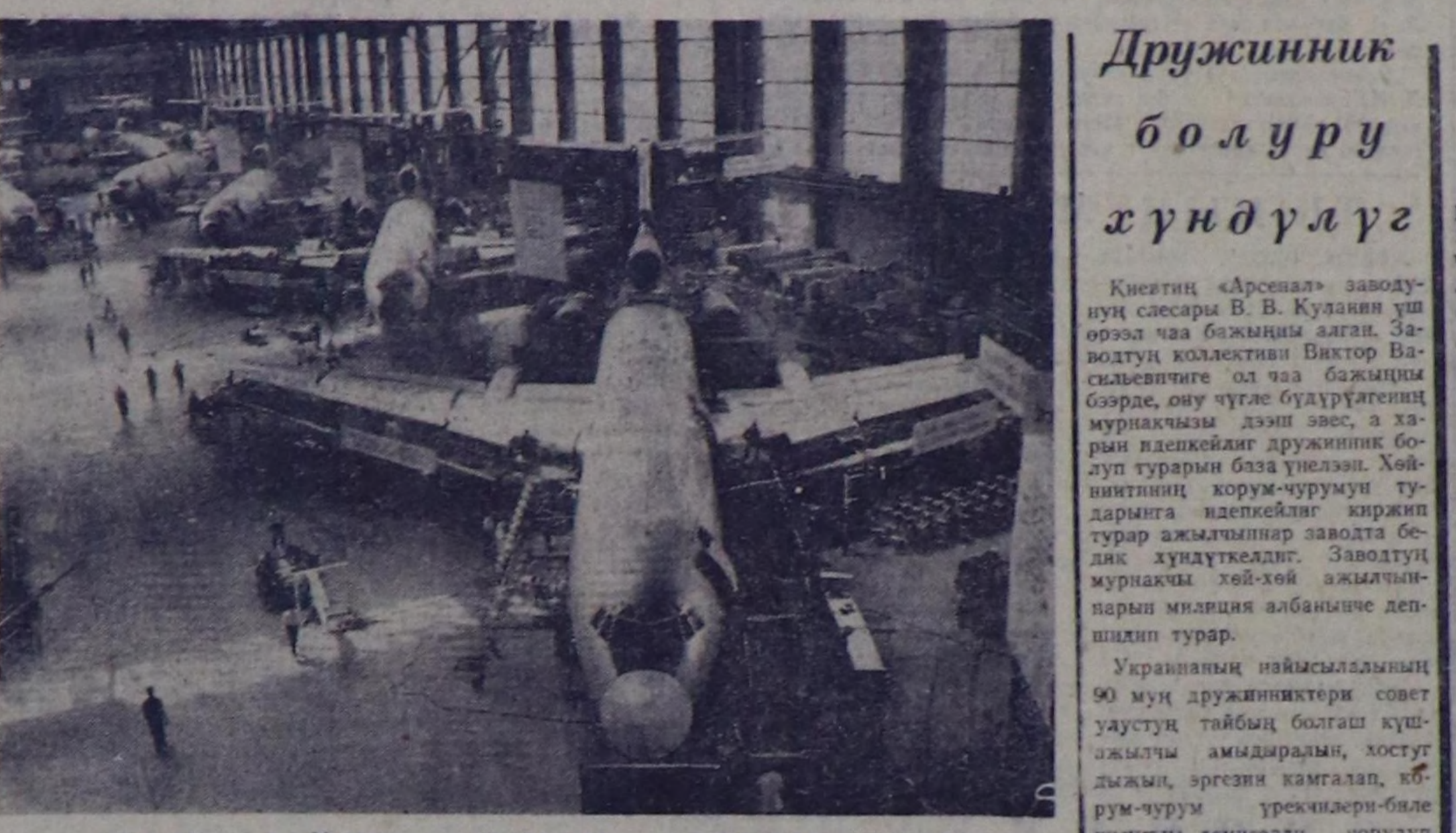
АГААР ЛАЙНЕРЛЕРИНИЦ БҮТКЕН ЧЕРИ

Улуу болгон тырм дурт-сылык ар кыя ээлик аякы-дышкан. Сырды көбөк кир-биктер адалан карактар кончуг тоштуп шычален көргөн, оң бакыны дымдар-сымаар дүктөр мөңтүлөлдү көргө берген болгон.