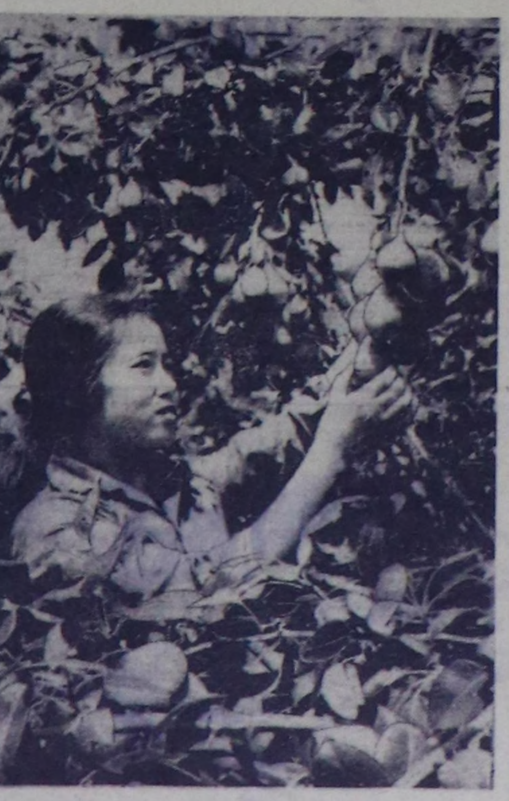
Көдээ ажил-агыны хөгжүдүп, интенсификааары ВАР-ның экономизациян хөгжүдүрүшкү планларында көл чөлдөр-нүн бирозын ээлеп турар. Бис дүрүрери-биле чергелешти-рога, чимис өстүрер амылда калбартып болур хей-хей аргалары амылдар кылдыр хой адырың амыл-агыны тургузарыңче улуг кичээнгейни салып турар.

«Совет Эвилелиниң ол поли-тиказын өңзапап шижешки-лиңиң кызгалдады, феодал-дык болгаш мөлдүгени алып эрткен, социал чөптүгү буюу догундарың чедип ал-ган бис. Чепсек күүжү дегээр империалисттик монополияны Совет Эвилели-биле найыра-лыштың азында амын, бөлдөк Аман плановың түдүк, экономика талазы-биле ха-маарышпас чорукчулук үнө-лөм болган үйстүрүтү база