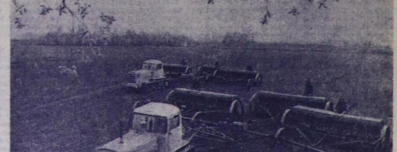
Алтайда хөвү ажалдары улам калбарып турар. Ирайын муруну болган төп районунун ажал-агылары ил кунтура — мезил-тасты кидин түлүк чаштырып турар. Чуга харыг кыштын болган хат-нарыскалыг, кургаг чактын урмуундан тараа чаштыргаларын мурунга берге сорулга салдыган. Тараажылгы техниканы мергенчилдиг амылган, мурунчыл агротехниканы өзүгар чаштыргаларынч мыска хуу-саада элтигин, черин өл-шынмын долдузу-биле чедип алыр дээш ора-

Районун ажал-агыларынын аразында социалистик чарык калбарган. Оон түнүп беш холуктап үндүрүп турар. Сөөлүг беш холуктап түнүп, СЭКП райкомунун, райкукомунун каттык хураалы үндүргөн. Оон шийткөөр өзүгар бирги черин Жланов аттыг совхозун механизаторлары ээлеп. Ук