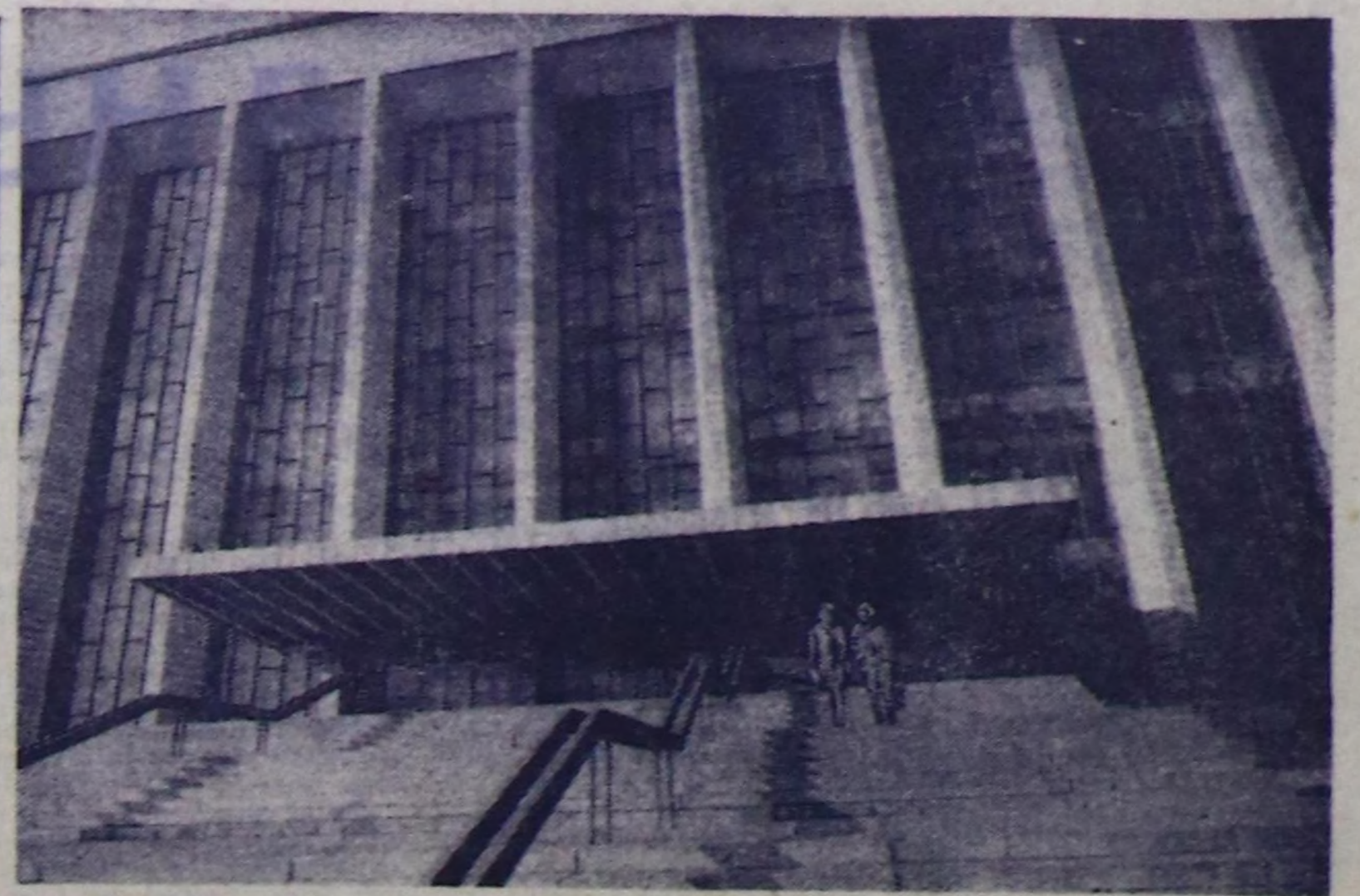
НОВОСИБИРСК. Бо чурунта ССРЭ-нің Эртемнер академиясының Сибирь салбырының...