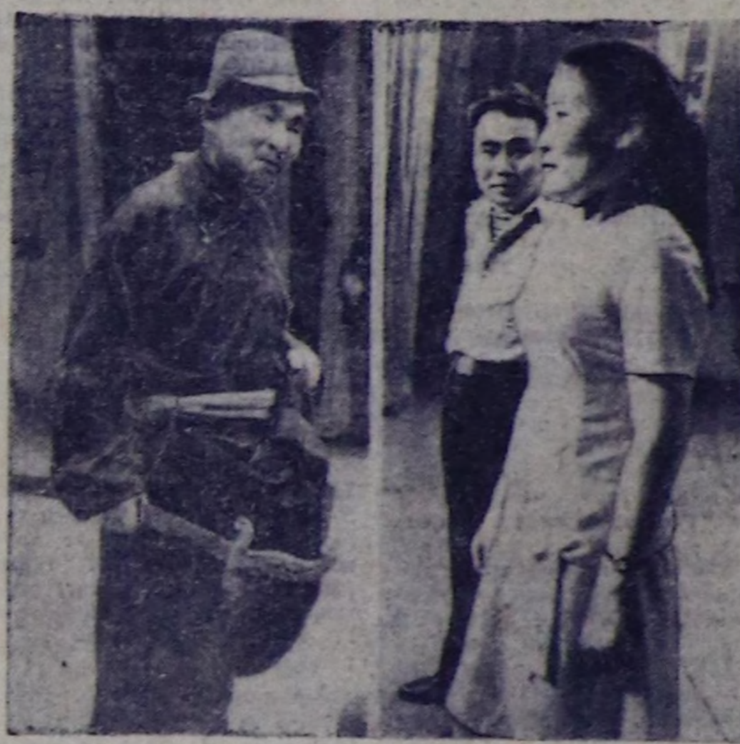
Адын дийданын, доол чоробе деп сагшык кирири чала...