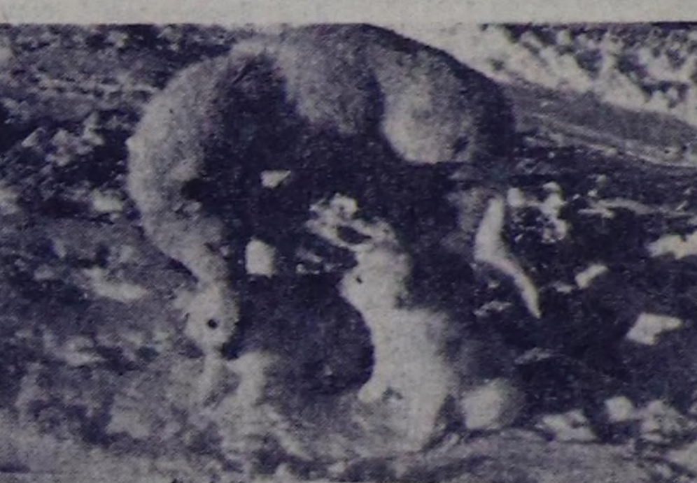
Чурунта — иениң часыдыды.