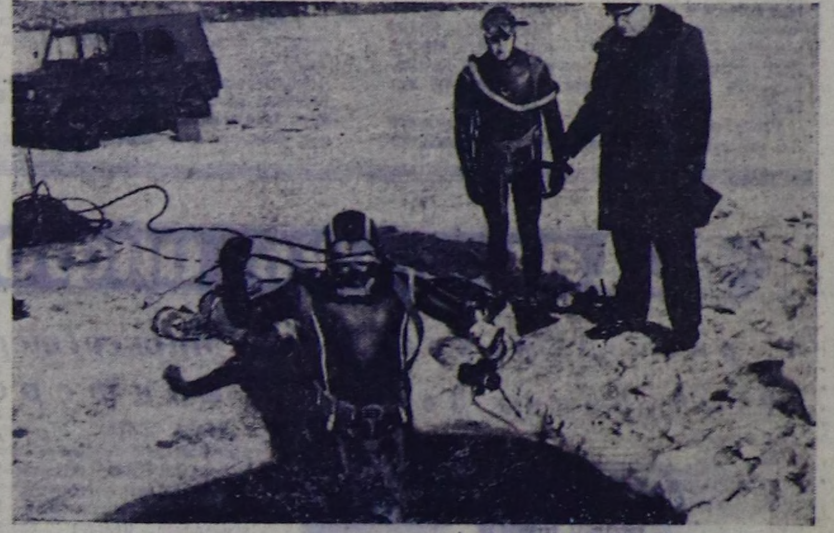
ЧУРУНТА: шинчээчилер лагеринде амыл хүнү ийдип тулук.