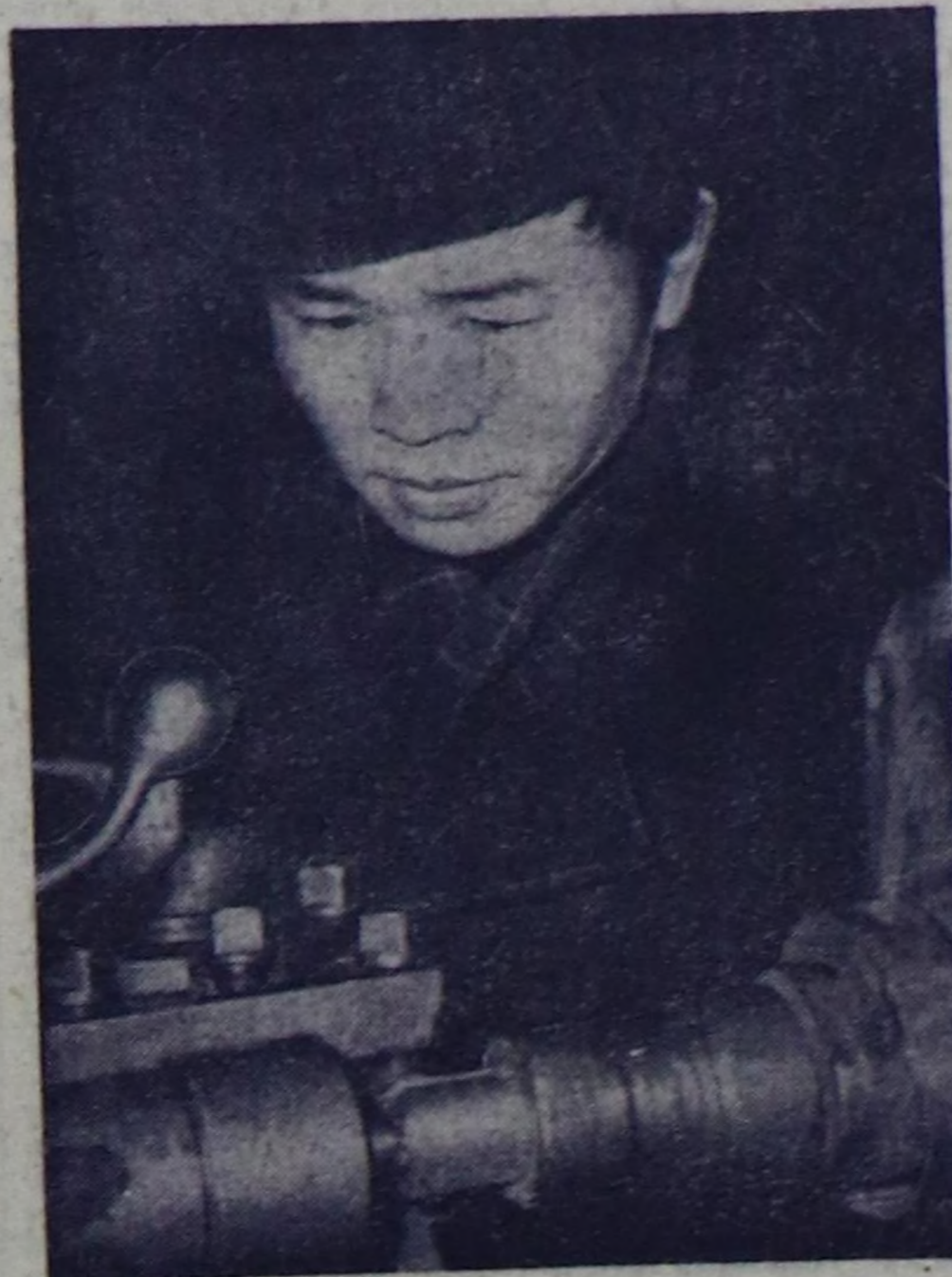
Талды районда «Тывага» совхозтун механизаторлары тракторлар сүзгөткөн март айның 25-те доозар деп социалисттик хүлээлгени алаш, хайышкыныг ажылдап турарлар. Машина-трактор мастерскаамында чоотка чаа бүдүрүлгө келген амылдар улууг соруктуг ажылдан турарлар.

Партияның Томск, Тюмень болгаш Вологда обкомнарының, ССРЗ-ниң Ыяш болгаш Ыяш белеткээр улетпурунун министрствозунун элчижип амылдаар участкага белеткээр бөлү турар. Малгаз-балалар болгаш Ыяш белеткээр орун-чирин багай черлерге Ыяш белеткээр амылды элчижип арга-Ыяш чорудары бүдүрүлгө черлериниң кулавыр Ыяш суурун калбартын болгаш Ыяш белеткээр, кылырның ил ажылыга ажылчыннар