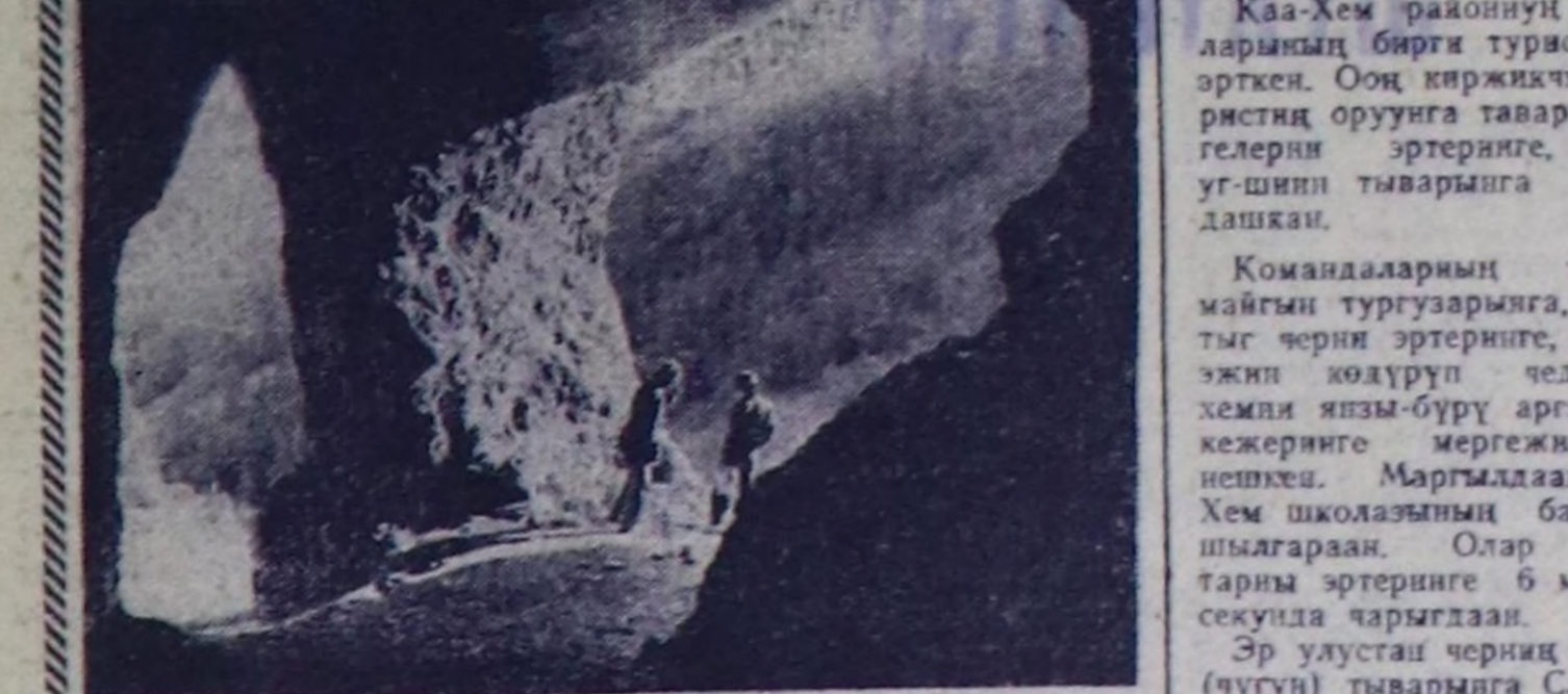
ЧУРУНТА: Кызылдың Нөк-Тей чанында дагда куй.