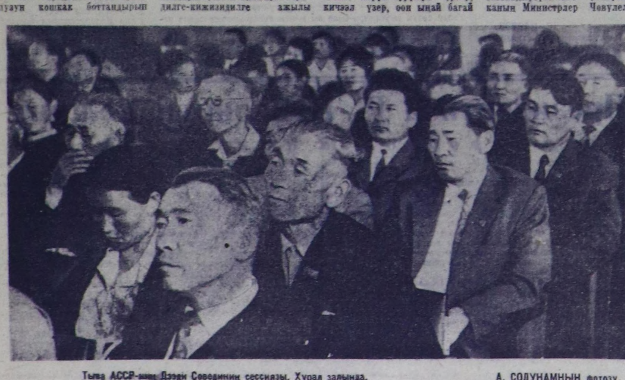
Тыва АССР-инин Дээди Советинин сессиязы. Хурал залында.

М. С. Салчак илеткелинги түнелинде беш чылдын тоза-радыгы чылы Тыванын ачылчы чоннарын юбилей-лиг, Совет Тыванын 30 чылы-биле капсарлашканын демге-лош, улус ачыл-агыш планы-нын ачыл-агыш бүрүү бугү күрүгүлгөр талазы-биле күү-сеткен турарын чедип алдыр дөш ачылды органнастарын Советтерин, бугу депутаттарын, ачыл-агышларын уду-рукчуларын сорулгазы бо-луп турарын чутугаалаан.