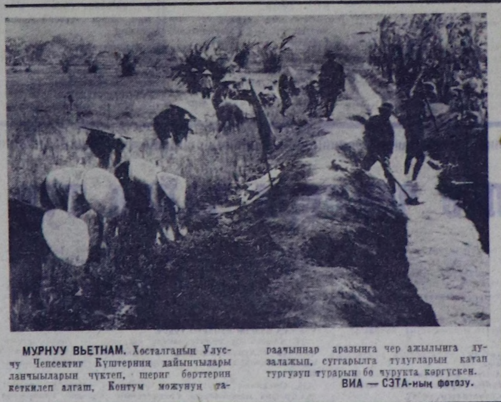
МУРНУУ ВЬЕТНАМ. Хосталганын Улусчу Чепсектиг Күштерин дайнычылары дымчыларын чүктөп, шериг бөрттерин кеткилеп алган. Контум мөжүнүр ара-чалынаар аразыга чер ажилында дугуурап турарын катан тургуурун бу чуртка көргүскөн.

нин бүрүн эргеви-биле чоруп, бизни туурашкуну амынаар кылдыр дээрин онзалап деме-лектеп тур мен. 1972 чылдан Москва, а он соонда эрткен чылы Вашинг-тонга болгаш белик деннеге совет-америк чургаалашкыш-тык херек кырынга үнегил уре-түндүлөгил болган деп, М. Менсфилд чургаалган. Биз-тин ийи чуртун улаустары-ларын чургаалашкышкын көөр хөй-хөй айтырларынын нарын болгаш берге-да ботбайнаан, мнчанга оларын дораан-на, чинги-биле ширитилерини бол-дуурамын демеген билдингир. Мында-ла-да Совет Эмелде-ги биле Американын Каттыш-ка Штаттарынын аразыга кыл-да-далага ажиыткы кады ажылажылганын мөн-а-ла сон-гаар кылдырыга боттат арга-лар бооп турар деп, М. Менсфилд чургаалган.