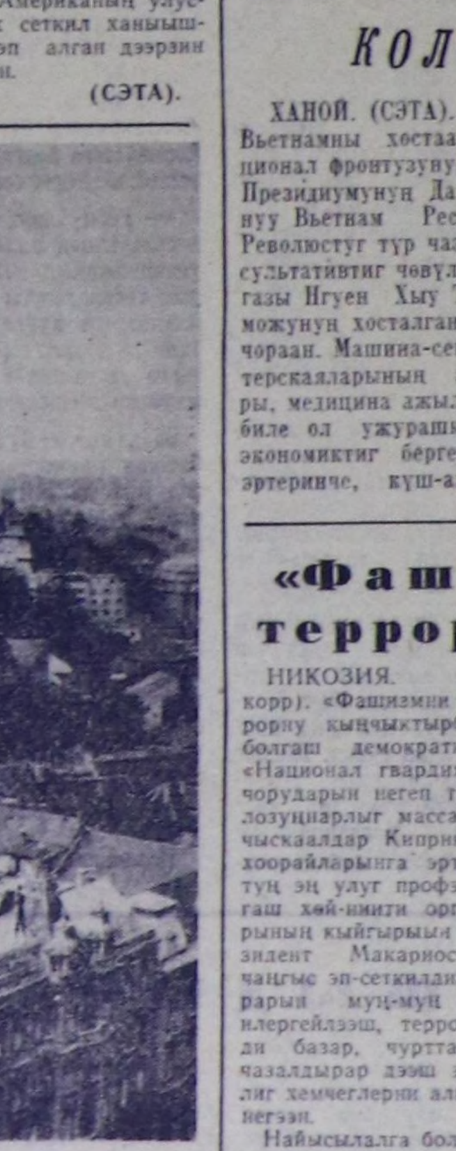
Загреб—ажыл-иши. Оң «Раде Кончар» комбинатынын, телехарылаза дериглерини Никола Тесла атыг заводунун, эмерайма буюур «Плва» фабрикасынын продукциязы хей-хей чурттары, оларнын аразында Совет Эвилелинге эң беини-биле өнүктүрүшү.

КОМОСОЛ АЛМИНИЙ УЛЕТПҮРҮН ХОЖУДУР, АВТОУСТАР БОЛГАШ САНАЛА ТЕХНИКАЗЫ БУДУР ТААЗЫ-БИЛЕ ЧАКТЫН ПРОГРАММАЗЫН КҮӨСӨДӨРИНГЕ ШЕФТИ ТУРАТ.