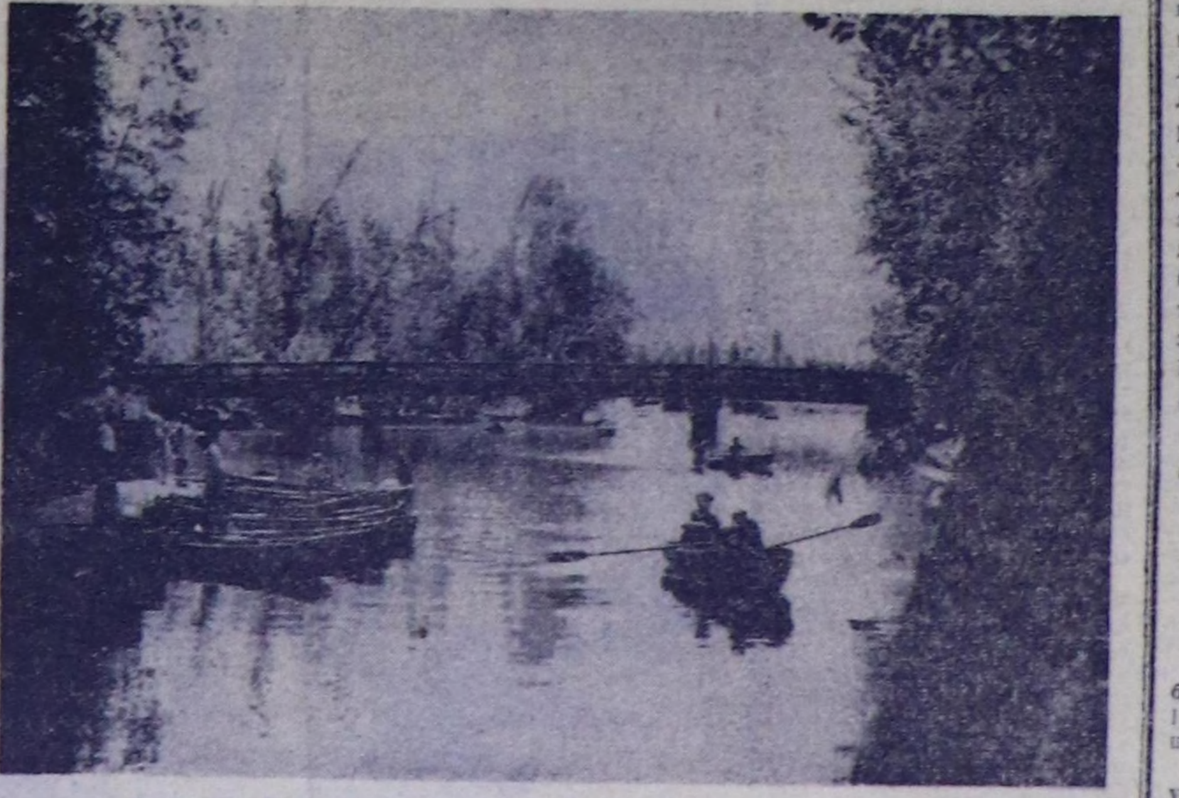
Кызылдың Гастелло аттыг пармынчыр булук. Чаа көвүрүг.

«Эзелиниң оргарларын генералдары» 16.55, 17.20, 21.15 шактарда. «ВОСТОК». Киночынында 12.30. «Күзөлдөрүн куусеттинери». 14.00, 15.00, 18.00, 20.00 шактарда. ЧАЙГЫ КИНОТЕАТР-А «Эресс, шөвалы-биле» 13.00, 15.00, 16.50, 18.40, 20.30 шактарда.