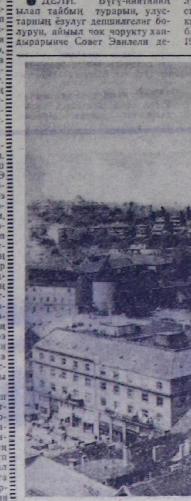
Загреб—Хорватия Социалист Республицанын найысылалы, умур-дузанын талазы-биле Югославиянын ийги хуорайы.

Казы-хаймыга ажыктыг, уре-түндүк кады ажылдажылган баш бир өскө чырыктык чыккыч Совет Эвилелинин Индия-биле экономиктиг харылзаалары болуп, 50 чылдар үзгүлөз ол харылзааларын тургузуп, ошуну быжыглаарычче утталган.