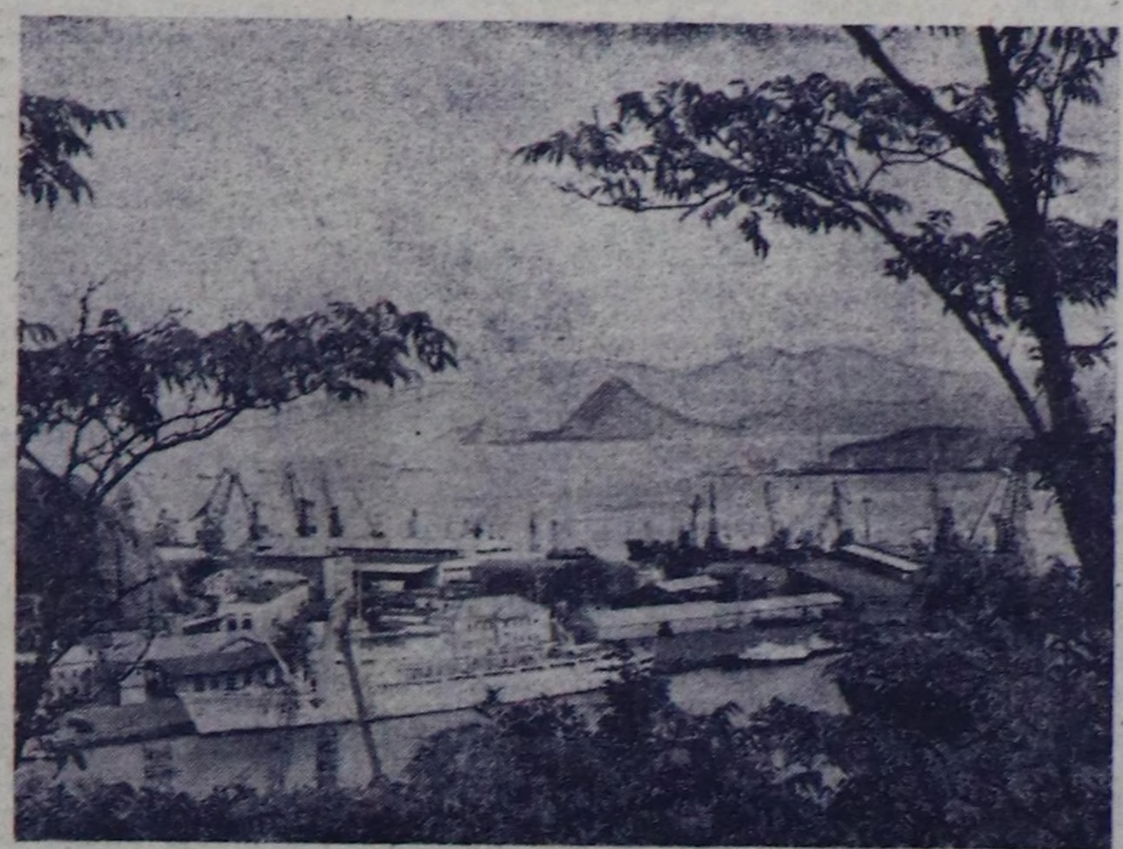
ПРИМОРЬЕ КРАЯ. Наход- ка — Бракмы Чоон чүкте деле- гезиңиң улуг порт хоорайы.

«АТУ-30»-де «БелАЗ-531» деп чыгыс өскөткү күчүзүг тыртыкчыны болгаш узу-