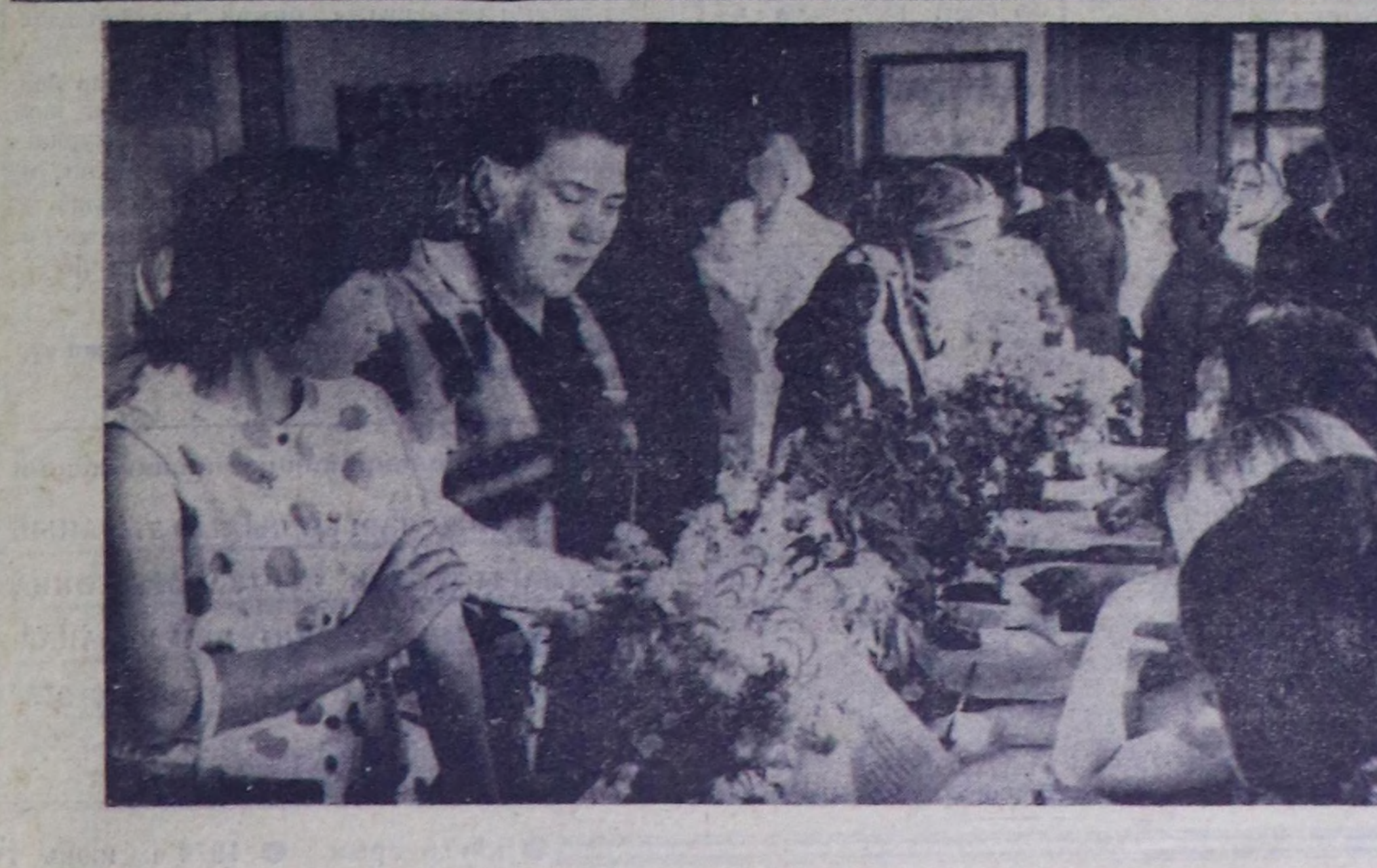
ЧУРУКТАРДА. (Солагай таладан) Кызылдың Новостройельный соңгулда участогунун соңгулда комиссийының кежигүнери келген соңгукчуларга бюллетеньнери берип турары. Ортузунда чурукта Октябрьская соңгулда участогунда бадылаашкынар үези. Сөөлүгү чурукта 48 дугаар туугу эргеле-