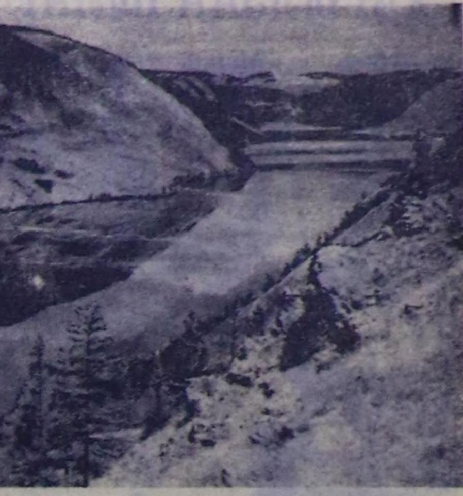
Бай-Тайга районунуң Кара-Хал.

Ычан тыва оң будулуң турган, Бөрүңде чыныктып кижил бурдуңуң-де согурп, оран-тандалыңа чалбарып чоран. Лама, хам, хелип, кескиң, чапан, дүжүмүк дээр, оларны бээжинчелер-ла улдуу чок. Ындыг хилиңчекти көрүп, оңу богу өкүңге чүктен келген оол феодал Ургу-Назын-ның хоюн кадарып чораш оксү-хөрөө ыры, хөөмей-биле чавырылдыр, сагыш-сетки-ли алаактырып чораш.