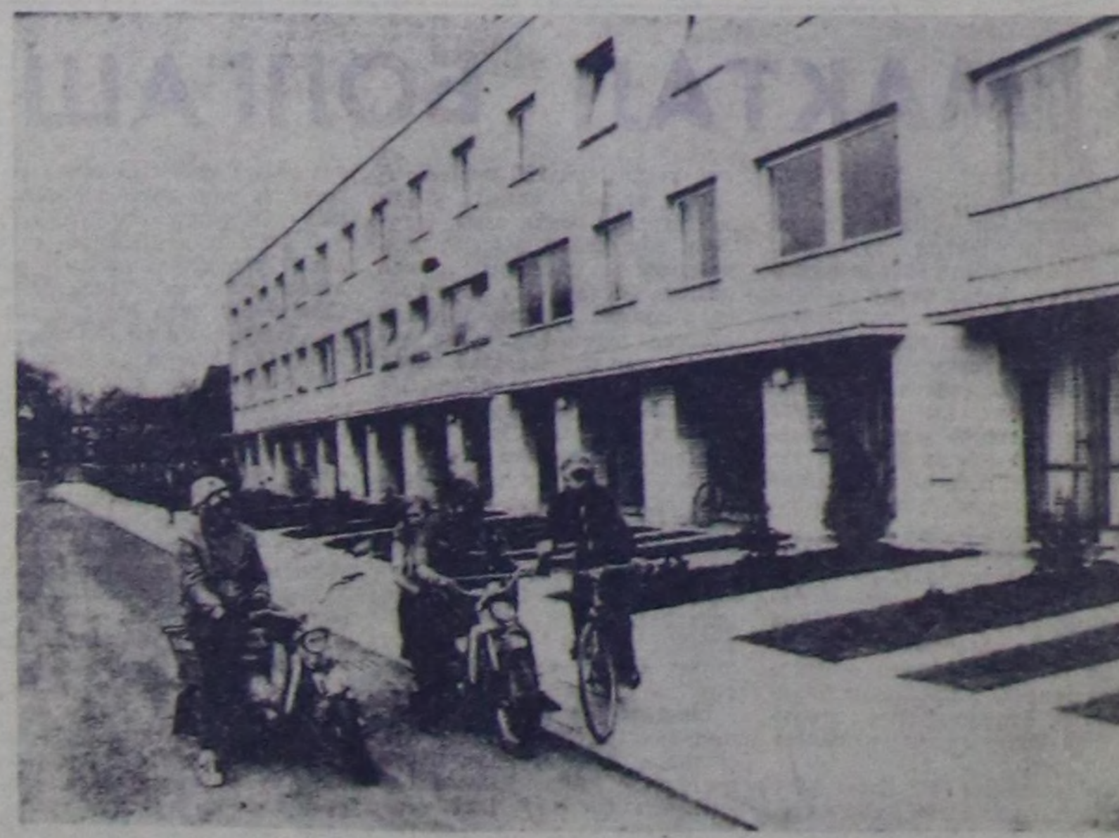
Чехословакияның хөвү-шөлдөрүң ажил-ишчилери чачгыс дай көздө ажил-ишчилериң түңгөндүгүң...