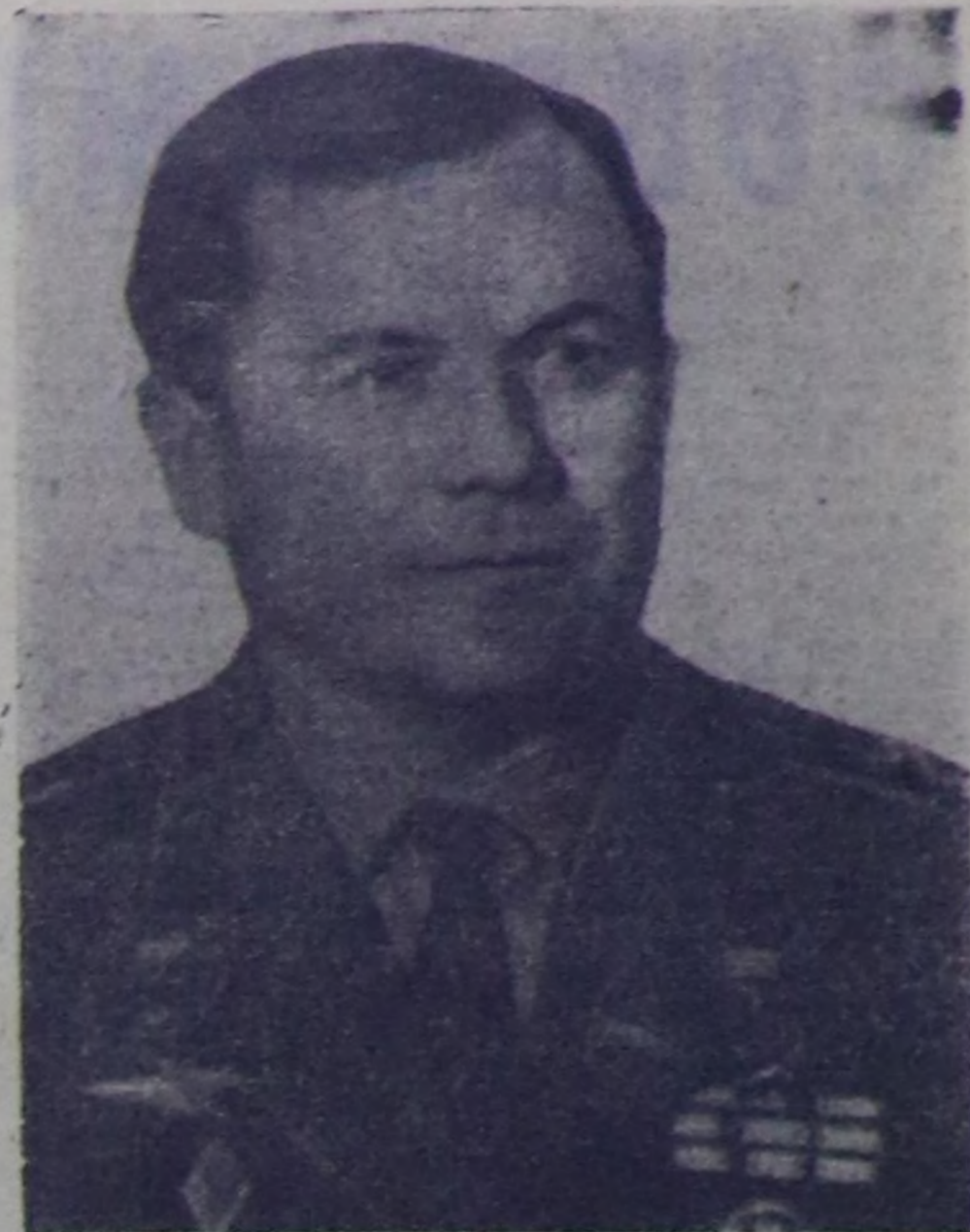
Павел Романович Попов—ССРЭ-нің ужудукчу-космонавты, полковник, Совет Эвилелиниң Младшы.

Радио харылзаашының залчеглиг чугалажышкыны болуп турда, килпаш деңги чок апар байдалга таарышкан болгаш ужудушкунга көрдүнгөн программаны күүүсепил тур деп П. Р. Попович дыңаткан. Поповичиниң болгаш Артохниниң инити бойдалы эки. Ужудушкун таарымчалыг эртип турар.