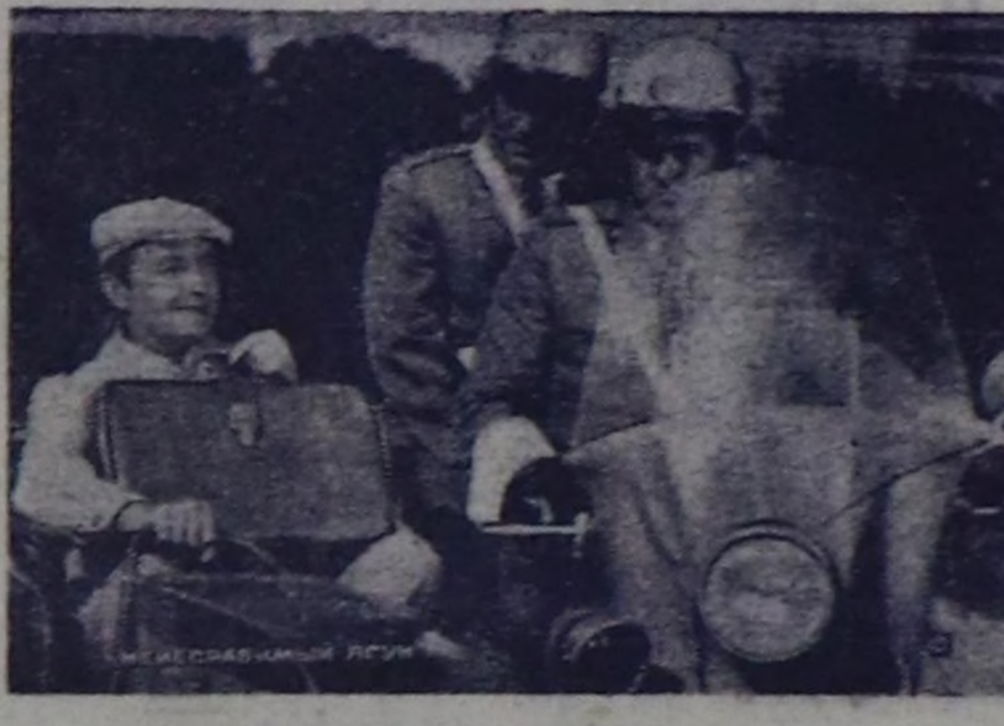
«Этниме мегечи» деп кинодан каар.

«Доктор Калининанын хун бую чымылы». Бу кинонун ады утказынга малайла дүтүп турат.