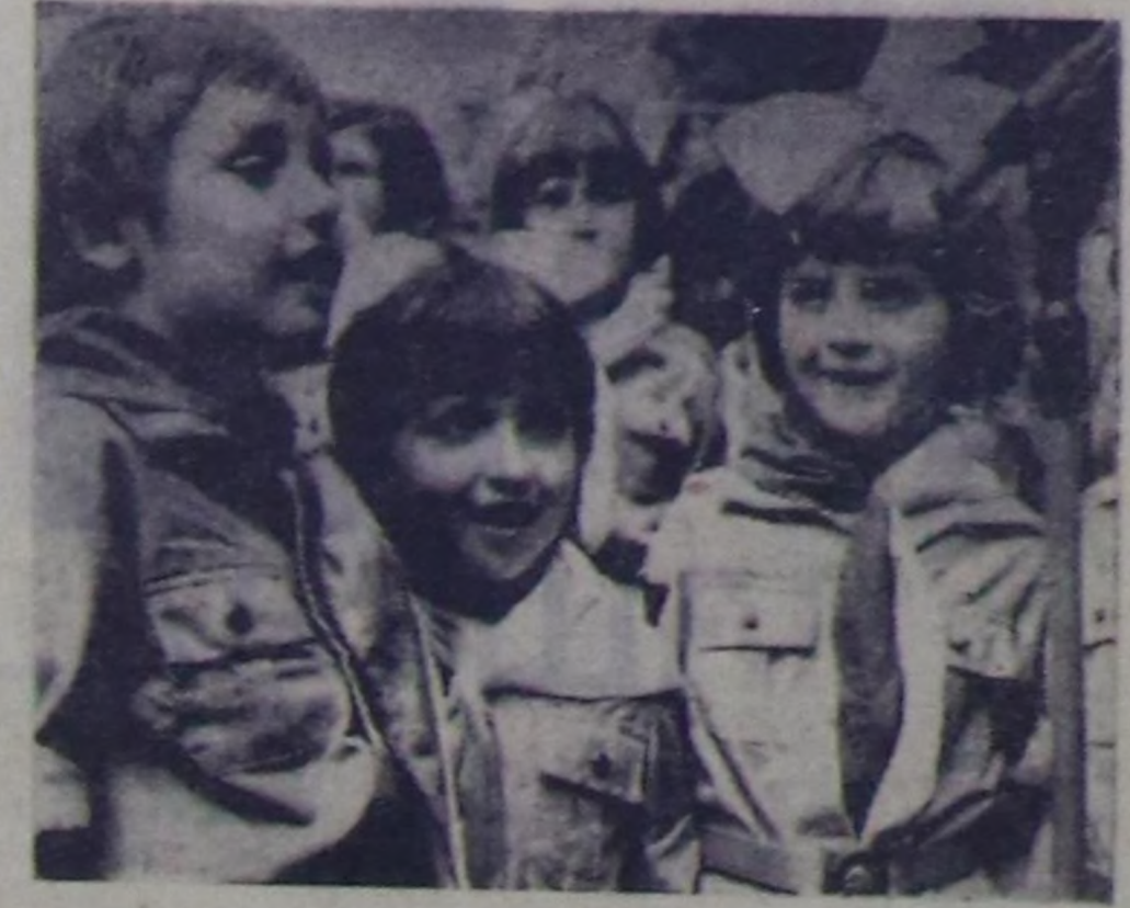
Польша Улус Республиканың бичи чаштары аас келжиктиг үдө өзүп турарлар. Олар «кыжын школаларга өөренип, пионерлер бажырларына ойнап, хөгөд турар. А чайын олорго чүс-чүс лагерлеринч болган санаторийлерин ажилда-лар. Оларынч кадыкшалын белек мергежилди өмчөлдөр хай-гаарлар турар. Удурлар кадык-шыраа, ажил-иичи, ак сеткил-де болган коммунист нийтиледи тургузарынч улуг хер-езинге шычы кылдыр өсүн дээр республикада бүтү-де чүгөлдөр кылган турар.

Польша-совет найырал нийтилеи ПУР-нуң ажилчы чо-нарнын интернационалдык өзүга кижизидер талазы-биле улуг болгаш хой таламг ажилдарынч чорудуп турар. Хей-ниити-нинч массалык бо организациялар Польшаның Наттышкан ажилчы партиязынынч дөт удурулгалы-биле ажилдаы-шаан, ССРЗ-де коммунист тургузушкунуу чедиркичи-нинч пропагандалар, Совет Эмелининч болгаш улугу Польшаның арзында найыралды болгаш кады ажилдамганы бүгү таламг хөгүдеринге база быжылаарыга улуг улуг-ну кирип турар.