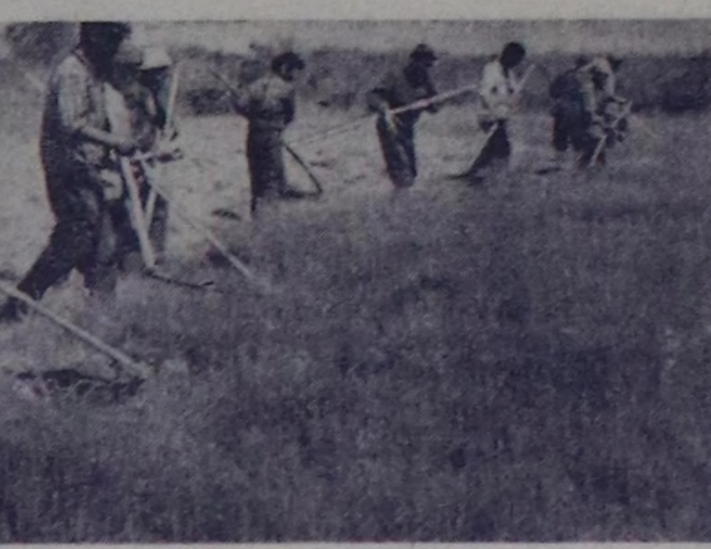
ЧУРУНТАРДА: эвенонун хол кайтырмы-биле сичег кезикчилери кезилде үезинде.